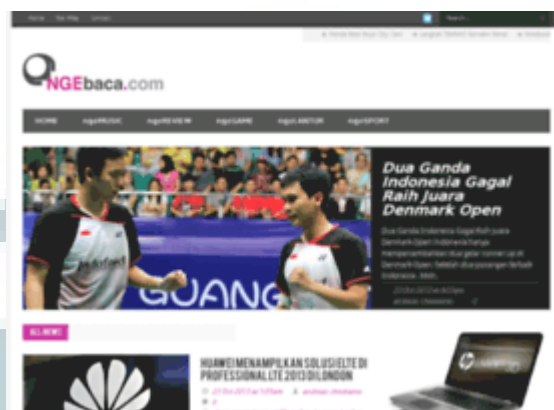
Gambar 2.2 Tampilan Web

Selama berkembangnya situs ini, ngebaca.com terus mengembangkan design webnya dari fitur dan lainnya. Dengan lahirnya website ini, ngebaca.com ingin membuktikan pada masyarakat bahwa ngebaca.com mampu memberikan kepuasan bagi pembaca dalam mencari informasi menarik yang tidak kalah dengan situs lainnya.