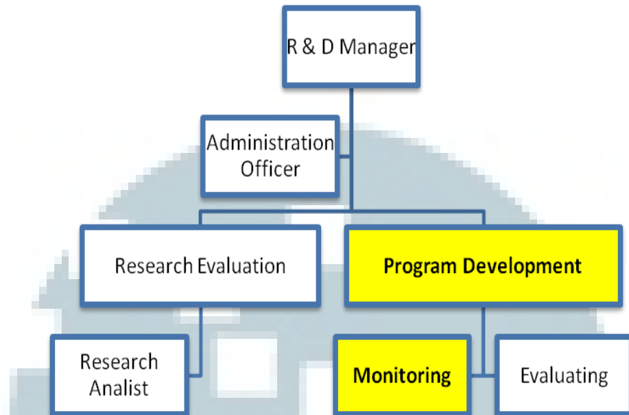
Gambar 2.4 Struktur Research and Development Department