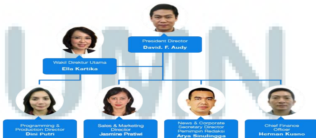
Gambar 2.1 Struktur Organisasi PT Global Informasi Bermutu (Global TV)

Struktur organisasi adalah sebuah bagan yang menggambarkan hubungan antarjabatan, termasuk juga posisi serta pertanggungjawaban setiap jabatan. Setiap perusahaan pasti mempunyai struktur organisasinya masing-masing, begitupun dengan PT Global Informasi Bermutu. Namun, penulis tidak dapat memberikan deskripsi pertanggungjawaban setiap jabatan secara rinci dan hanya bisa memberikan struktur organisasi Global TV saja. Hal tersebut dikarenakan pihak perusahaan sendiri tidak memiliki cukup waktu untuk memberikan data terkait kepada pihak di luar perusahaan.