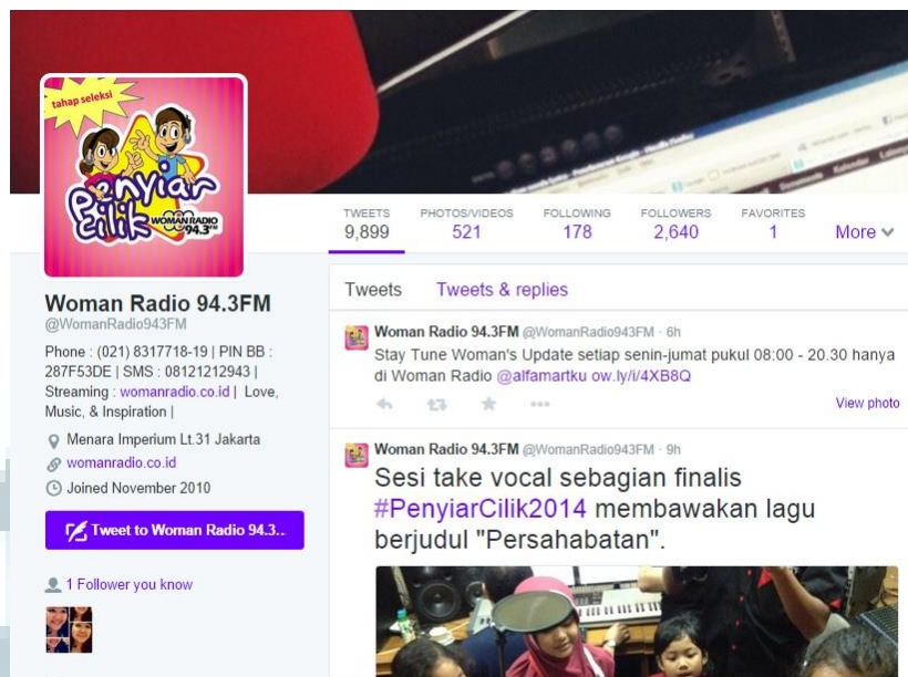
Gambar 2.6 Aktivitas Twitter Woman Radio