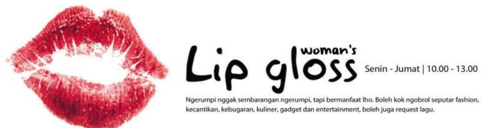
Gambar 2.8 Program Woman's Lip Gloss