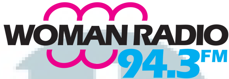
Gambar 2.1 Logo Woman Radio