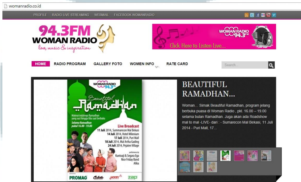
Gambar 2.3 Tampilan Laman Woman Radio