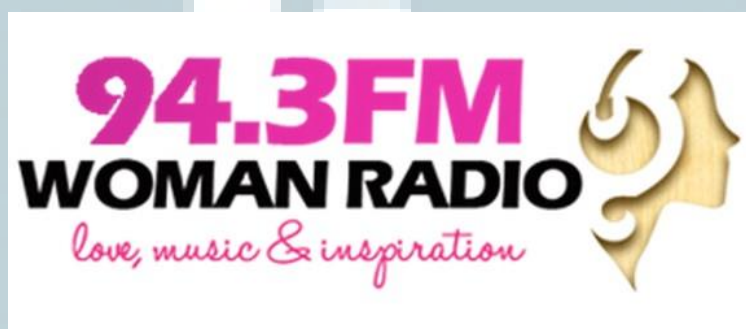
Gambar 2.2 Tagline Woman Radio (Love, Music & Inspiration)