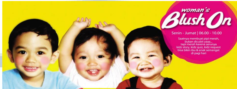
Gambar 2.7 Program Woman's Blush On