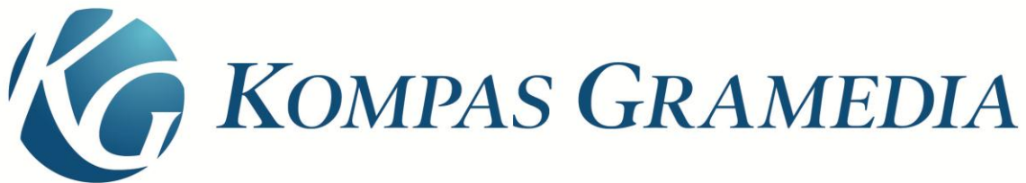
Gambar 2.1 Logo PT. Kompas Gramedia Majalah