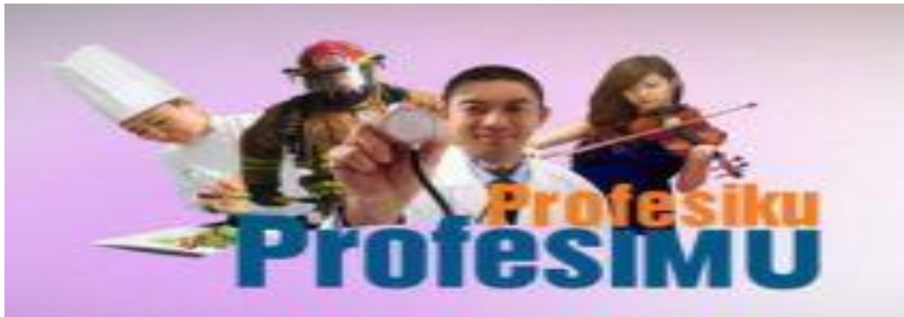
Gambar 2. Logo Program “Profesiku Profesimu”

Dari program di atas penulis ditugaskan di divisi talkshow , dan di dalam program “Profesiku – Profesimu”.