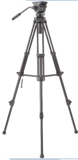
Gambar 3.2 Tripod