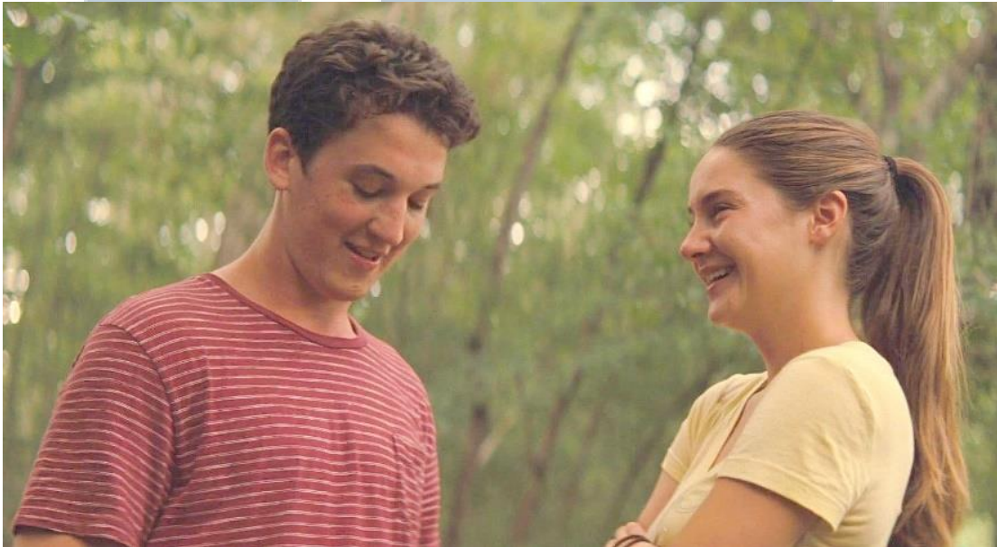
Gambar 3.5 Adegan film The Spectacular Now (Screen capture film The Spectacular Now )

Penulis memiliki beberapa referensi acuan berdasarkan penggunaan komposisi terhadap hubungan karakter yang mana penulis memiliki dua karakter yang memiliki hubungan erat secara emosional. Penulis sendiri ingin memvisualisasikan kedekatan karakter dengan penekanan terhadap komposisi dan pergerakan kamera.