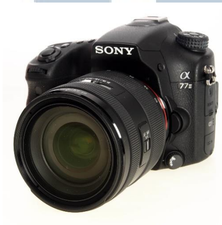
Gambar 3.1 DSLR