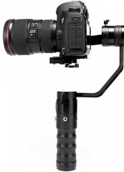
Gambar 3.3 Stabilizer