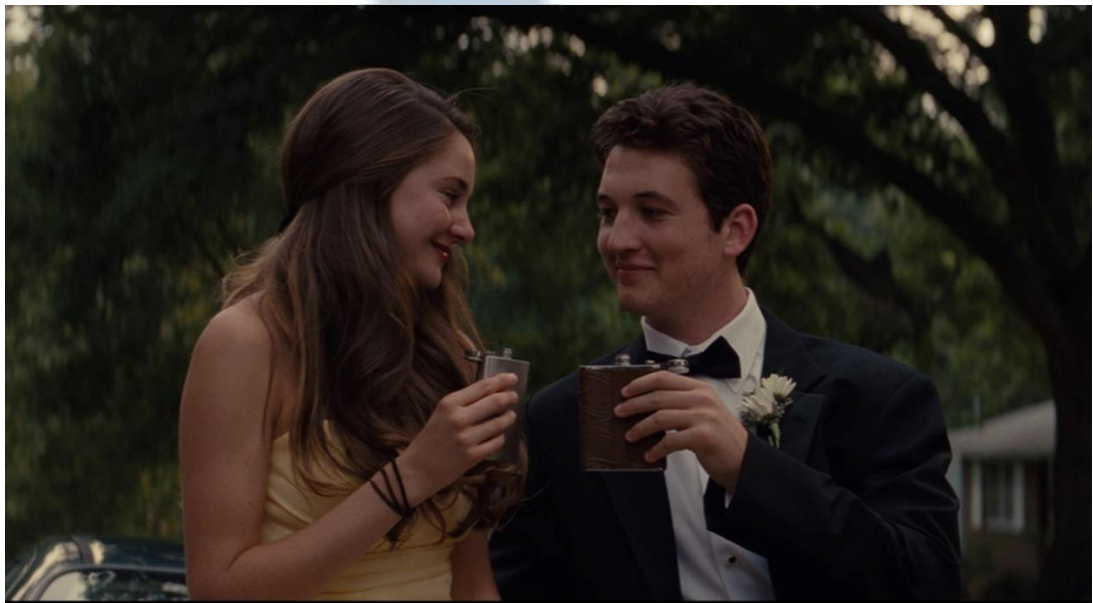
Gambar 3.6 Adegan film The Spectacular Now (Screen capture film The Spectacular Now )