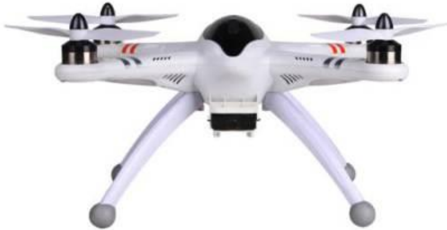
Gambar 3.4 Drone