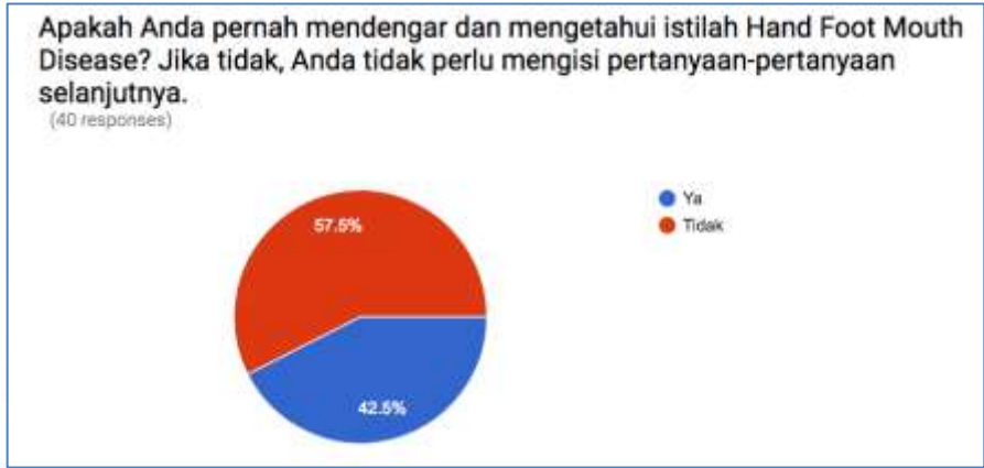
Gambar 3.4. Pengetahuan Responden