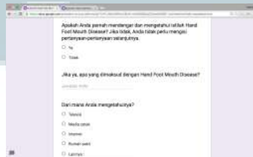
Gambar 3.2. Pertanyaan Kuesioner (Dokumentasi Penulis)