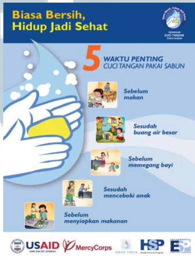
Gambar 3.10. Kampanye Biasa Bersih

Pesan kunci yang diangkat dari gerakan ini adalah “dengan menjaga kebersihan, maka kita sudah menjaga kesehatan”. Informasi yang ada dalam kampanye ini disampaikan secara denotatif. Kemudian, terdapat ilustrasi yang memudahkan masyarakat mengingat dan menangkap informasi yang disajikan oleh kampanye ini. Warna yang digunakan didominasi oleh warna biru yang mewakili air yang merepresentasikan kebersihan. Media yang digunakan dalam kampanye ini adalah media cetak, seperti poster, banner , dan brosur.