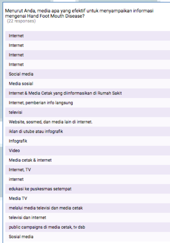
Gambar 3.8. Media

Berdasarkan data diatas, dapat diketahui bahwa sebanyak 78.3% responden merasa bahwa informasi mengenai hand foot mouth disease belum cukup memadai. Sedangkan 21.7% lainnya merasa bahwa informasi mengenai hand foot mouth disease .