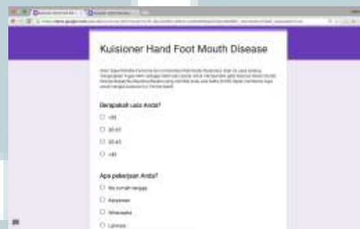
Gambar 3.1 Pertanyaan Kuesioner

media informasi apa saja yang sering digunakan. Kuesioner tersebut ditujukan secara khusus kepada orang tua yang memiliki anak usia 4-6 tahun dengan tingkat pendidikan minimal SMA. Penulis menentukan target kampanye sosial berdasarkan hasil riset studi literatur dan wawancara dengan narasumber ahli.