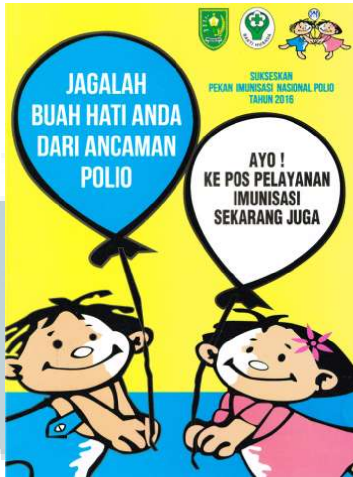
Gambar 3.9. Kampanye Polio Berbahaya