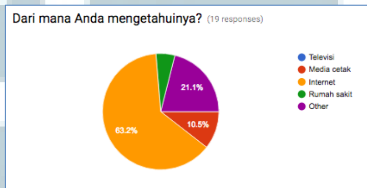
Gambar 3.6. Sumber Informasi

Berdasarkan data diatas, dapat diketahui bahwa dari 18 orang responden yang mengatakan bahwa mereka mengetahui istilah hand foot mouth disease , sebanyak 8 orang menyebutnya sebagai Flu Singapura, sebanyak 7 orang mendefinisikannya sebagai penyakit kaki tangan mulut, dan 3 orang menjawab dengan jawaban lainnya.