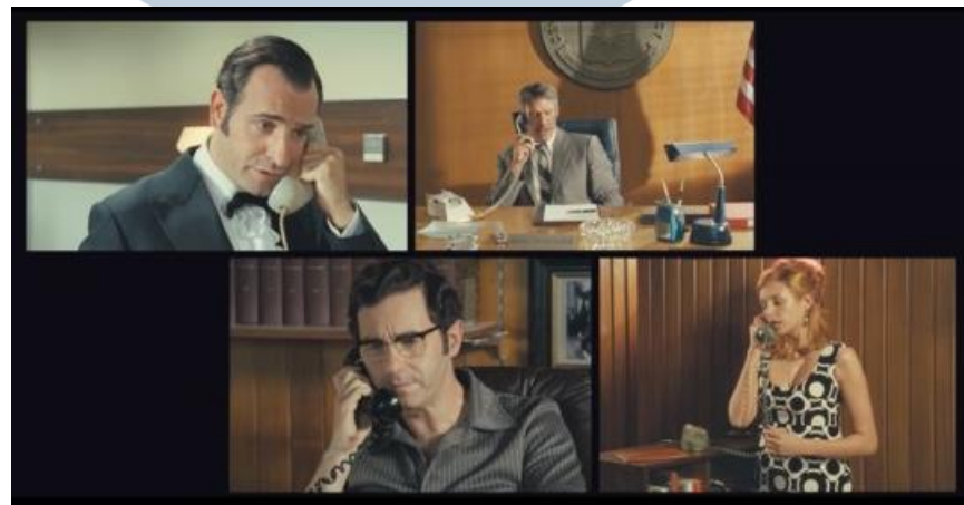
Gambar 3.2 Scene Telephone on Film "Pillow Talk"

Pada proyek tugas akhir ini penulis dan tim akan membuat Company Profile Video . Video Company Profile akan berisikan informasi tentang Universitas Multimedia Nusantara dari sejarah pendiri, visi dan misi, fakultas, program studi, unit kegiatan mahasiswa, perusahaan dan kampus mitra kerja, sampai dengan alumni yang sudah sukses pada bidangnya masing-masing. Semua isi dari video tersebut harus direalisasikan antara 8 sampai 10 menit. Untuk merealisasikannya, penulis selaku Video Editor akan menggunakan teknik editing split screen agar video bisa memberikan dua gambar sekaligus dalam satu frame yang bertujuan untuk mempersingkat durasi video. Berikut gambaran split screen yang akan direalisasikan pada video.