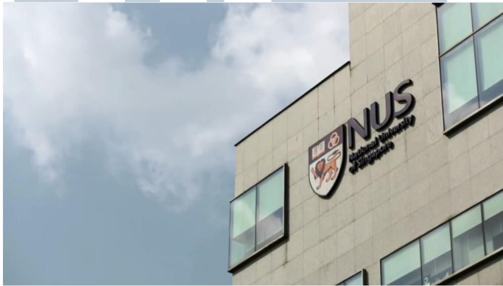
Gambar 3.3. National University of Singapore Company Profile

bagus. Dalam video Company Profile National University of Singapore berisikan informasi yang menarik diantaranya fasilitas kampus yang divisualisasikan dengan adanya interaksi antara mahasiswa yang sedang menggunakan fasilitas kampus. Hal lain yang menarik bagi penulis adalah scene sambutan Rektor National University of Singapore yang diambil dengan teknik pengambilan gambar yang baik dan menjelaskan universitas secara informatif.