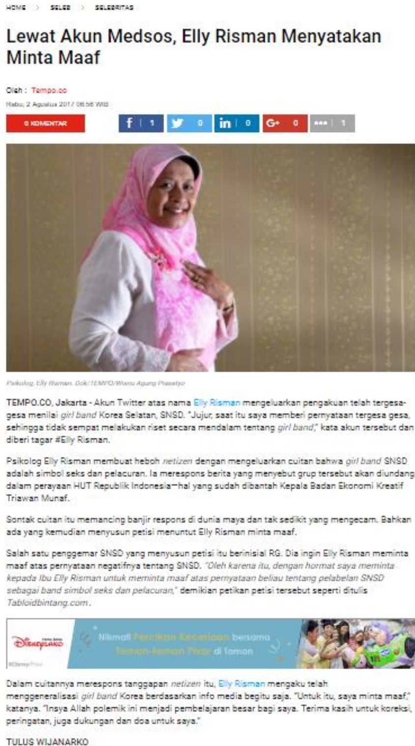
Gambar 1.2. Berita Elly Risman