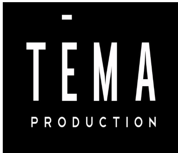
Gambar 2.1. Logo Tema Production

Tema Production merupakan production house atau rumah produksi yang berawal dari melayani pembuatan jasa video Pernikahan ( Wedding Video ) pada tahun 2013. Selama berjalannya waktu, Tema Production berkembang ke kategori lainnya yang menjadikan production house ini sebagai salah satu penyedia jasa dalam pembuatan konten video di Indonesia.