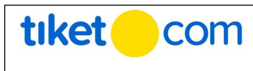
Gambar 2.1 Logo Tiket.com (Zamroni M, 2017)

Awal mulanya Tiket.com telah menjadi rekan bisnis Kereta Api Indonesia. Kemudian perkembangannya hingga kini Tiket.com telah bekerjasama dengan beberapa maskapai di Indonesia, tempat atraksi hiburan, event konser untuk memudahkan orang untuk memesan tiket di internet dengan harga terjangkau murah. Logo dari Tiket.com ditunjukkan pada Gambar 2.1.