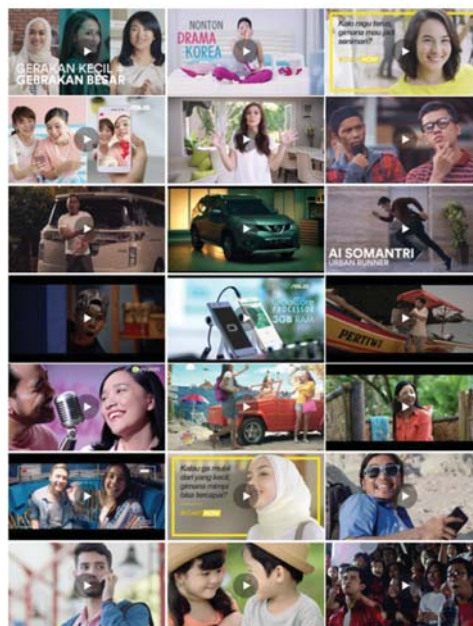
Gambar 2.2 Hasil Karya Milkyway Studio

Project pertama yang dibuat oleh Milkyway Studio adalah sebuah Digital Commercial untuk “Achilles” pada tahun 2005, dan sampai sekarang Milkyway Studio telah membuatkan video untuk Indomie, ASUS, Garuda Indonesia, dan beberapa Client besar lainnya. Milkyway Studio juga pernah memenangkan Pinasthika Award untuk beberapa video seperti Webseries “Gara-gara Saaih” yang dibuat untuk Smartfren dan “Pasar Malam” yang dibuat untuk Indomie.