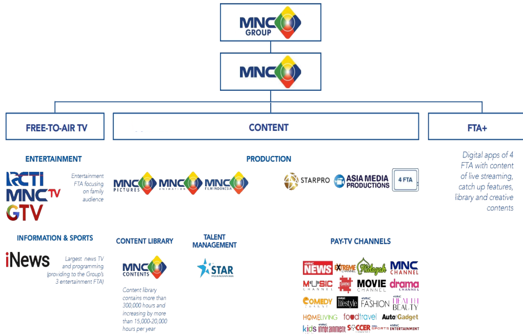
Gambar 2.1. Struktur Organisasi MNC Group

iNews berada di bawah MNC Group. Berikut terlampir struktur organisasi MNC Group: