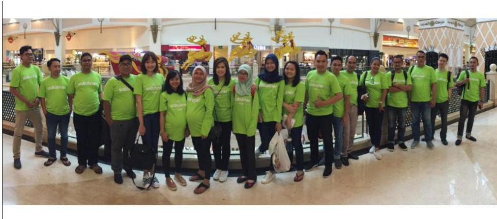
Gambar 2.3. Tim Wakuliner 2018 (Dokumentasi Perusahaan, 2019)

Suasana bekerja di kantor Wakuliner terasa cukup santai dan nyaman. Penulis diizinkan untuk menggunakan sandal dan kaos selama di kantor. Rekan kerja di Wakuliner juga terasa akrab dan sepemikiran karena usia mereka yang terbilang muda. Rata – rata usia pekerja Wakuliner berada di kisaran 25 sampai 35. Pegawai Wakuliner mendapatkan makan siang gratis di kantor berupa catering yang sudah di kemas per porsi. Penulis beberapa kali diajak makan dan jalan – jalan pada saat pergi ke lokasi untuk melakukan proses shooting . Rekan kerja penulis juga seringkali mengingatkan penulis jika sudah melebihi jam pulang kantor ataupun makan siang.