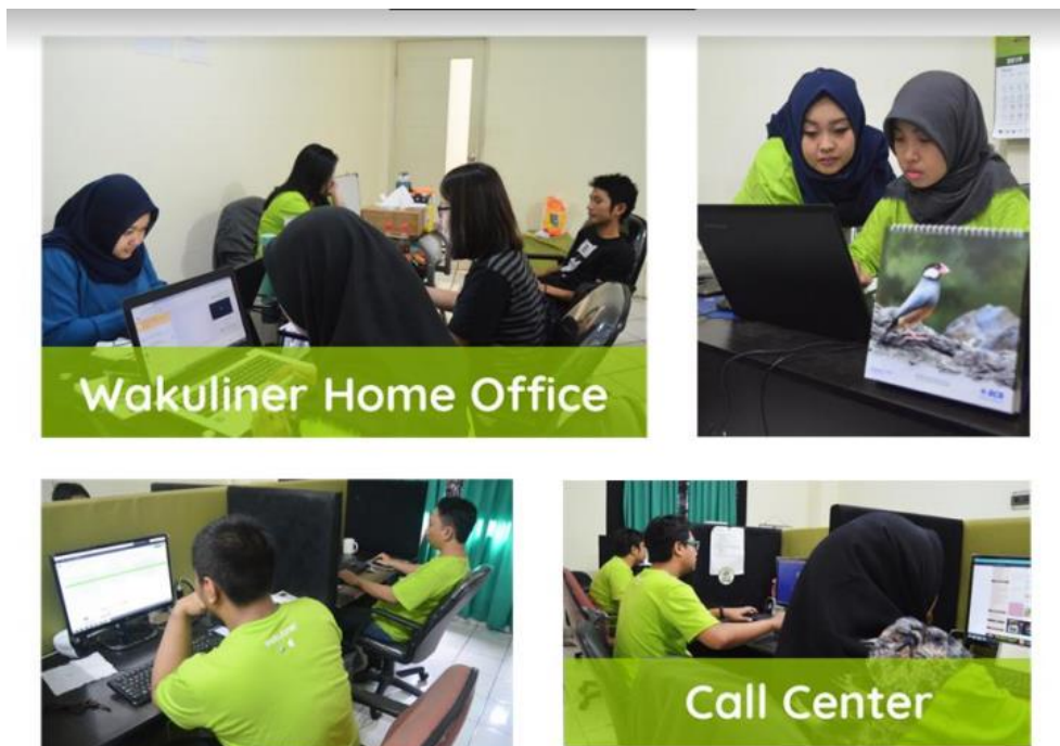
Gambar 2.2. Ruang Kerja Wakuliner di Ruko Odessa (Dokumen Perusahaan, 2019)

Wakuliner berlokasi di Ruko Odessa Timur Blok AD nomor 21, Jl Boulevard Gading Serpong, Tangerang Selatan 15811 namun pada Juni 2019 pindah ke Apartment Paddington lantai 8, Tower B, Alam Sutera, Tangerang Selatan karena Wakuliner membutuhkan kantor yang lebih besar dan memadai.