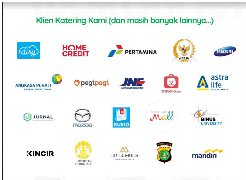
Gambar 2.4. Klien Wakuliner

Wakuliner sebagai perusahaan kuliner yang bergerak dari tahun 2017 mengandalkan salah satu fiturnya yaitu pemesanan catering baik dari bentuk nasi kotak maupun prasmanan. Terdapat beberapa perusahaan dan Lembaga besar yang sudah menjadi klien Wakuliner. Berikut adalah klien yang sudah pernah memakai jasa Wakuliner: