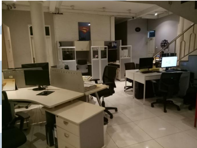
Gambar 2.2. Kantor HJ Production

Beberapa tahun sebelumnya, HJ Production pernah mengerjakan project sebagai berikut: