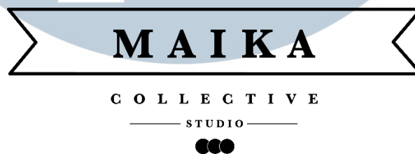
Gambar 2.1 Logo Maika Collective Studio