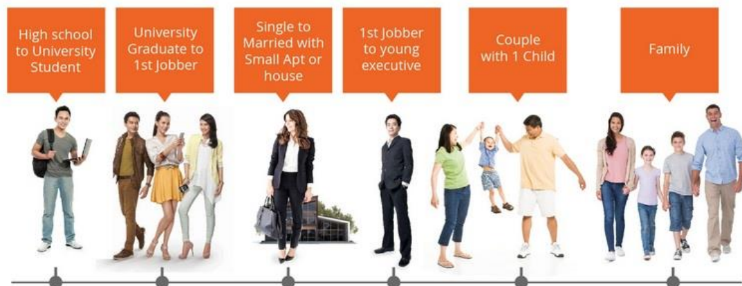
Gambar 2. 1 Target Market RUPARUPA.com

Target Market dari RUPARUPA.com adalah wanita dengan usia 25-35 tahun, dengan kriteria sudah memiliki penghasilan sendiri, bertanggung jawab dengan kebutuhan rumah tangga, dan mendapatkan informasi secara online.