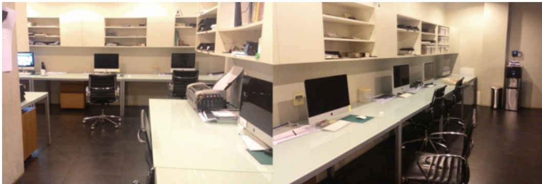
Gambar 2.2. Ruangan Graphic Designer Indigo Design & Development

Saat ini, Indigo memiliki 11 karyawan yang terdiri dari 1 Director , 5 Desainer Grafis, 3 3D Specialist , 1 Admin dan 1 Staff Pendukung.