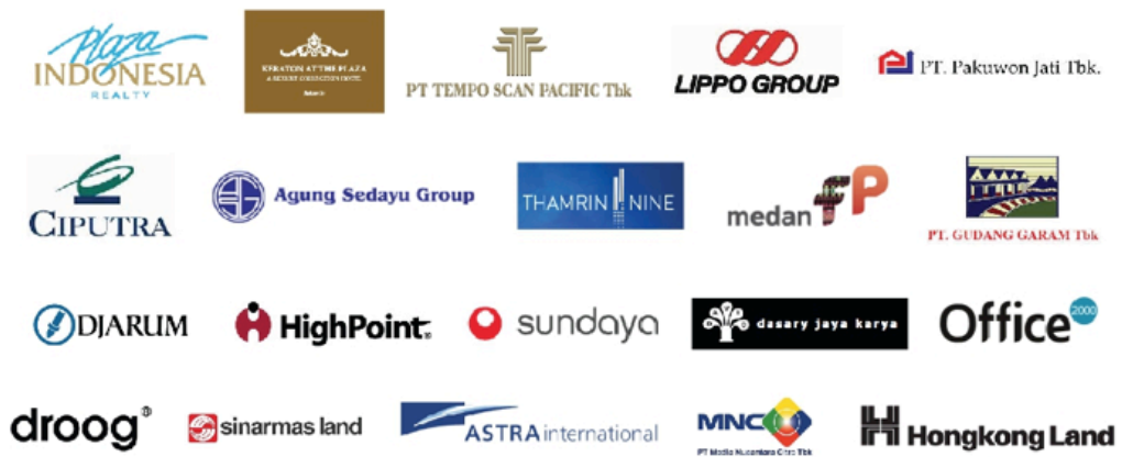
Gambar 2.4. Logo Klien Indigo Design & Development