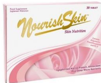
Gambar 2.3. Produk Nourish Skin