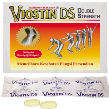
Gambar 2.5. Produk Albothyl Concentrate