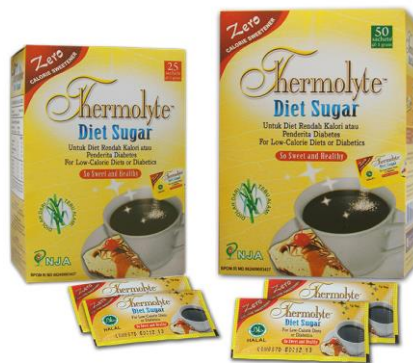
Gambar 2.6. Produk Thermolyte