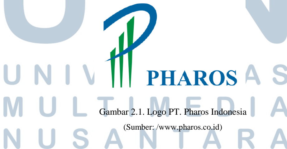
Gambar 2.1. Logo PT. Pharos Indonesia

Perusahaan yang berstatus Penanaman Modal dalam Negri (PMDN) ini merupakan sebuah perusahaan farmasi pertama di Indonesia yang mendapatkan sertifikat Cara Pembuatan Obat yang Baik (CPOB) oleh Badan Pengawas Obat dan Makanan (BPOM). Dalam keberhasilannya, PT. Pharos Indonesia didukung oleh lebih dari 2000 sumber daya manusia (SDM) dimana sebagian besar pegawainya merupakan tenaga muda yang masih dinamis dan berenerjik. PT. Pharos Indonesia juga menggunakan system komputer yang terintegrasi untuk seluruh divisi dan kantor cabang antara lain, Teleconference , VOIP, Internet, Computerized Product Knowledge Training , serta perpustakaan dan berbagai literturnya.