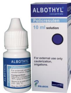
Gambar 2.2. Produk Albothyl Concentrate