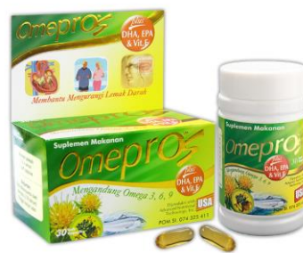
Gambar 2.4. Produk Omepros

U N I V E R S I T A S M U L T I M E D I A N U S A N T A R A