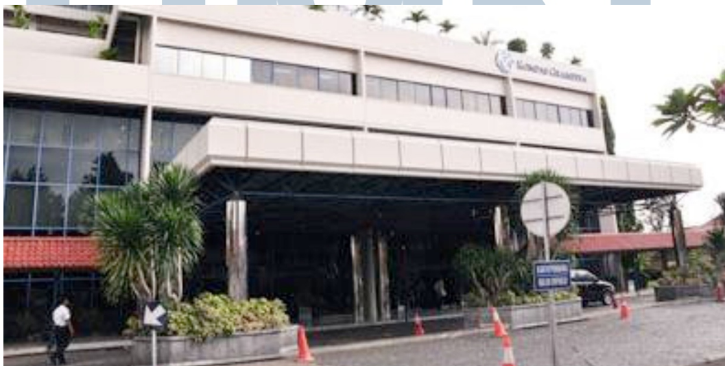
Gambar 2.1 Gedung Kompas Gramedia

Kompas pun memperluas jaringannya tidak hanya menjadi usaha yang berbasis pengetahuan akan tetapi Kompas juga melebarkannya melalui Magazines, Tabloid, Book Publisher, Retail & Distribution, Electronic & Multimedia, Hotel & Resort, Manufacture, dan Creative Bussines, Event & Venue . ( http://www.kompasgramedia.com/business )