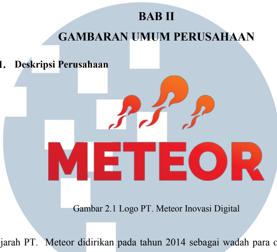
Gambar 2.1 Logo PT. Meteor Inovasi Digital

Sejarah PT. Meteor didirikan pada tahun 2014 sebagai wadah para orang-orang yang ingin berkolaborasi bisnis dan bertujuan untuk mengembangkan Acces Economy Platform . Untuk membangun suatu perusahaan yang formal membutuhkan waktu yang sangat panjang. seiring berjalannya waktu, dua tahun setelah Meteor berdiri pada tanggal 11 Febuari 2016 Meteor berhasil menjadi perusahaan yang terhitung resmi, arti logo pada meteor adalah meteor yang dianggap kecil namun jika bersatu dapat menghancurkan sebuah planet begitu pula dengan sharing economy yang dapat menghancurkan konglomerasi.