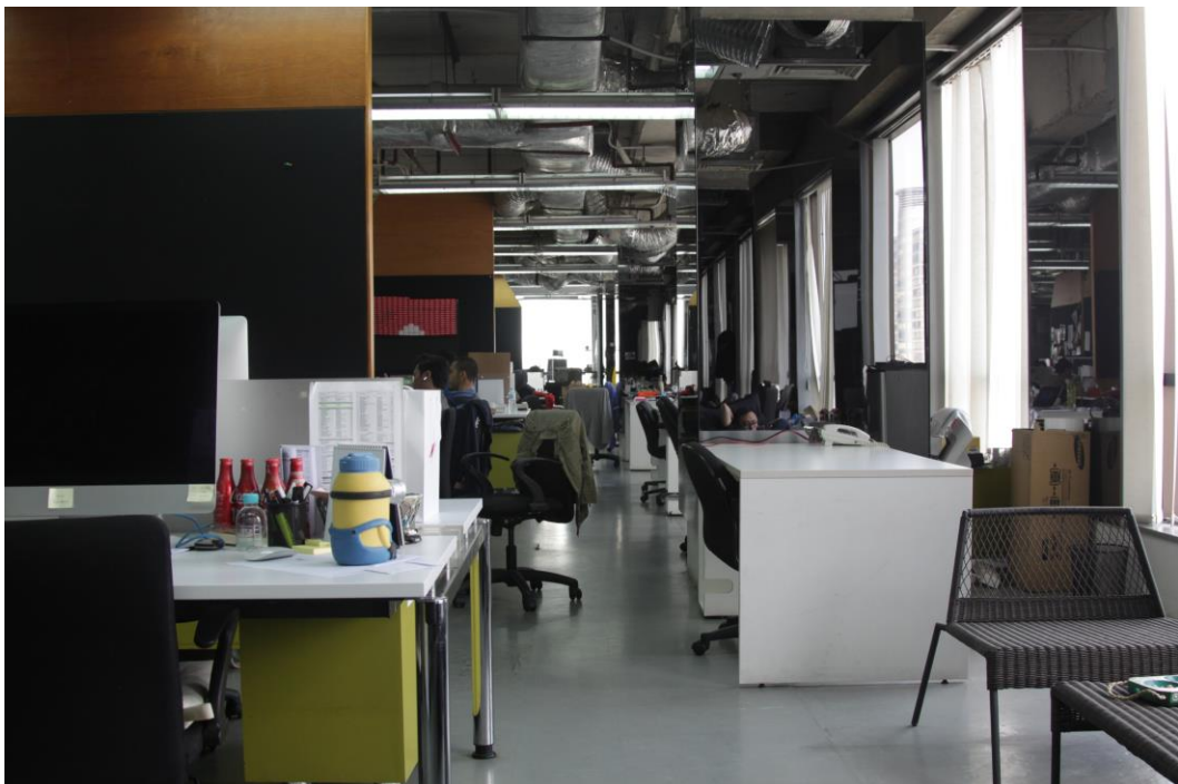
Gambar 2.7 Lantai 24 tempat departemen kreatif