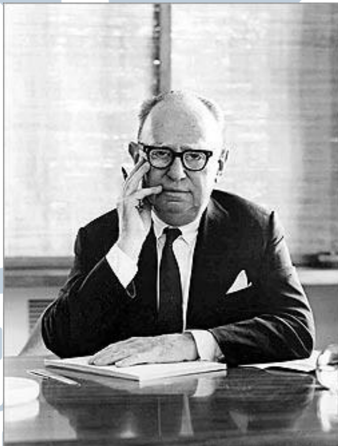
Gambar 2.2 Leo Burnett yang tersohor

Leo Burnett Indonesia adalah anak cabang dari agensi iklan multinasional Leo Burnett Worldwide. Leo Burnett Worldwide didirikan pada tahun 1935 oleh Leo Burnett di Chicago (wikipedia.org, 2017).