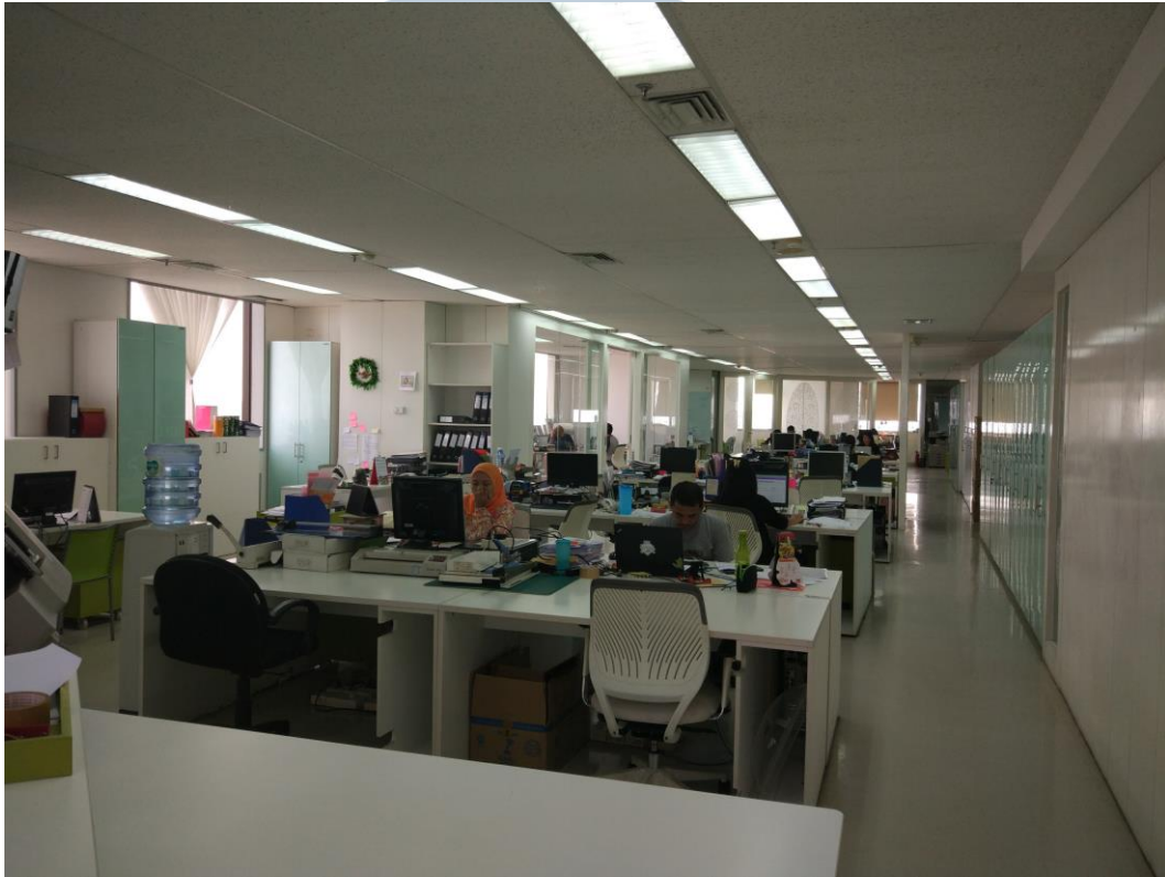
Gambar 2.6 Lantai 26 tempat departemen account (dokumentasi pribadi, 2017)