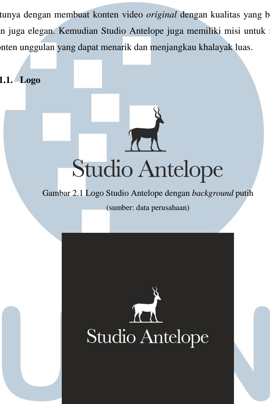
Gambar 2.1 Logo Studio Antelope dengan background putih