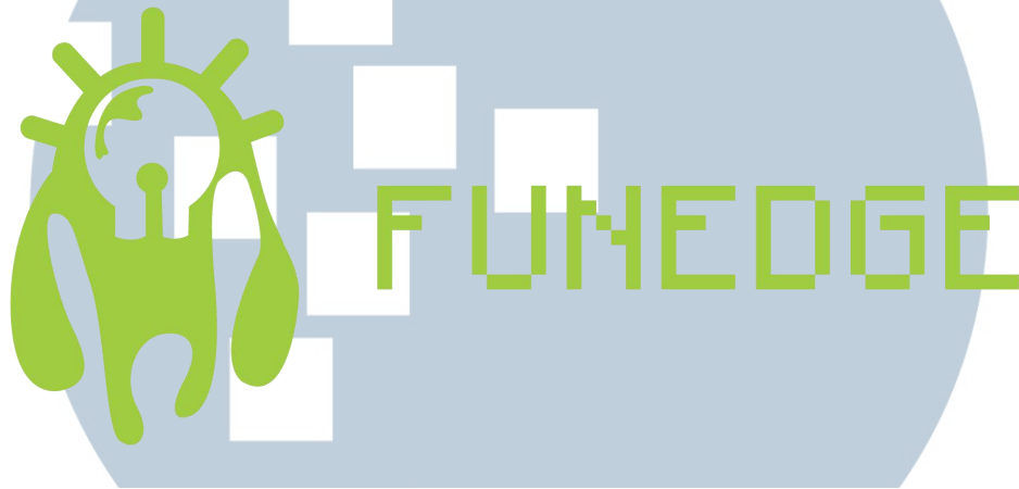
Gambar 2.1. Logo Funedge

PT. Kreasi Funedge Indonesia berdiri pada tahun 2008 sebagai Web Developer Agency bernama Web Express. Pada tahun 2011, Web Express berubah nama menjadi Lebah Biru dan berpindah ke ranah media sosial. Setelah dua tahun, Lebah Biru menambahkan pelayanan Creative Conceptualization dan Digital Technology ke dalam pelayanannya. Pada masa ini, Lebah Biru berubah nama menjadi Funedge yang digunakan sampai sekarang (Funedge, 2016).