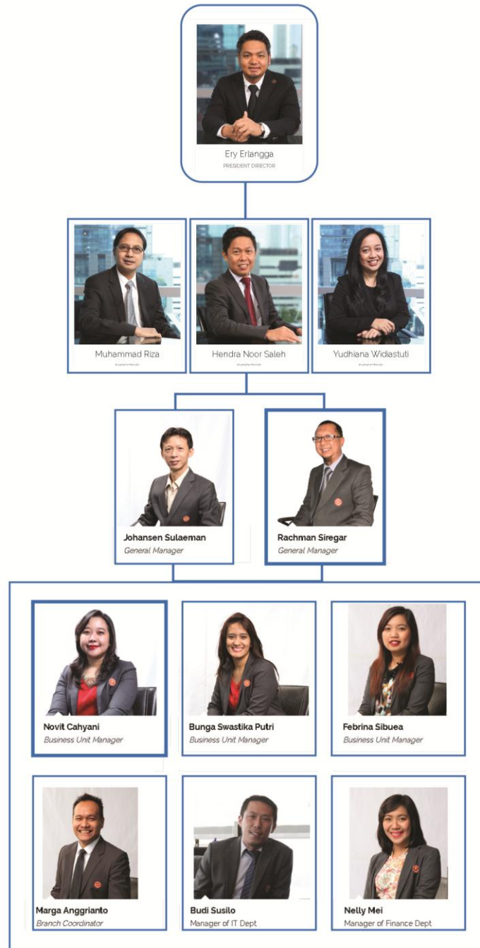
Gambar 2.1. Bagan Struktur Perusahaan