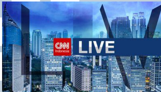
Gambar 3.8. CNN Live