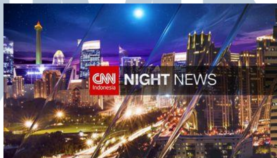
Gambar 3.13. CNN News Room