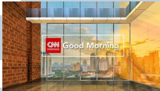
Gambar 3.12. CNN Good Morning