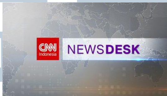
Gambar 3.6. CNN News Desk