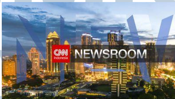
Gambar 3.5. CNN News Room