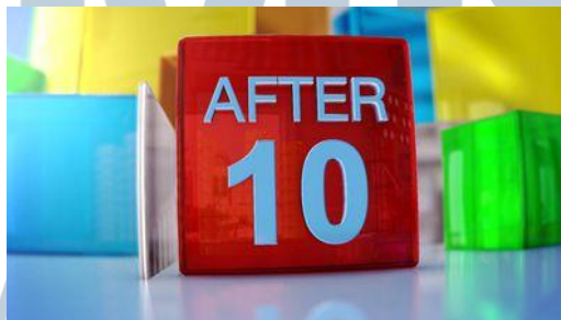
Gambar 3.9. CNN After 10