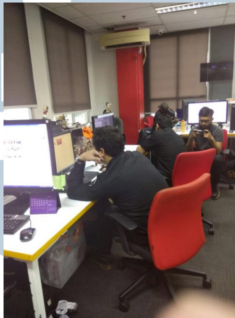
Gambar 3.4. Ruang Grafis

Ruang grafis berada pada lantai 3, yang letaknya berada di pojok sebelah ruangan marketing. Ruangan ini memiliki 3 komputer grafis, 2 komputer VIZRT, serta 1 Mac Apple yang diperuntukan untuk menerima pesanan grafis dan membuat grafis.