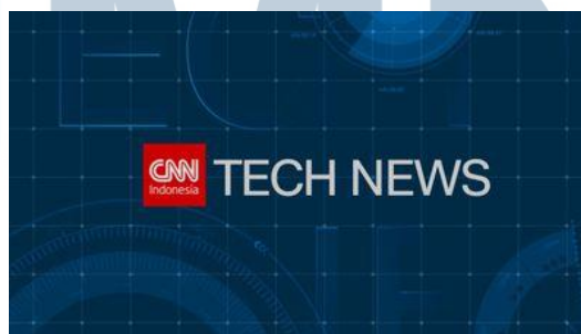
Gambar 3.11. CNN Tech News