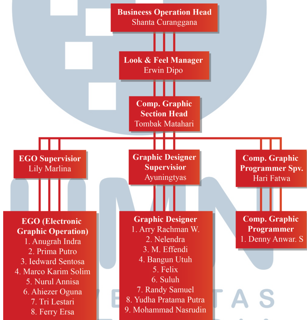
Gambar 3.2. Struktur Organisasi

CNN Indonesia memiliki beberapa departemen. Salah satu departemen adalah Look & Feel yang bekerja untuk membuat segala desain seperti infografis, Logo acara, Bumper , GFX, dan VIZRT yang diperlukan untuk mendukung sebuah berita. Di bawah ini adalah struktur organisasi departement Look & Feel