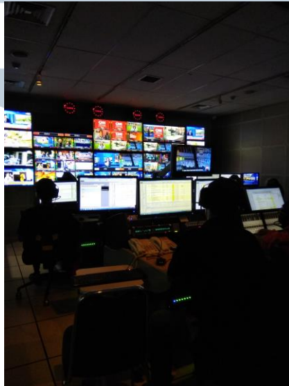
Gambar 3.3. Ruangan EGO

CNN Indonesia berada pada lantai 2 – 3A pada gedung Trans TV, di mana setiap lantai digunakan untuk setiap departemen. Lantai 3 digunakan untuk ruangan EGO sebagai pengaturan setiap desain yang akan dimunculkan ke plasma studio. Ruangan EGO harus tertutup dan gelap/ minim, dikarenakan banyak TV pengontrol siaran yang digunakan untuk mengawasi jalannya siaran dan mengatur arah kamera. Lantai 3 digunakan 4 departement yaitu bagian redaksi, editor, look and feel dan marketing . Sedangkan lantai 3A digunakan untuk ruangan HRD CNN Indonesia.