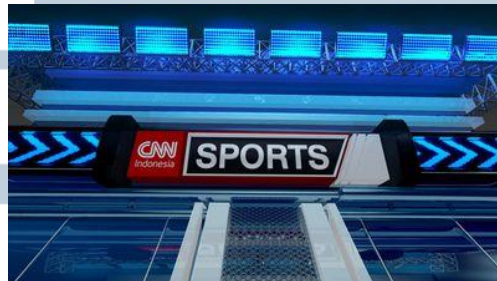
Gambar 3.10. CNN Indonesia Sport