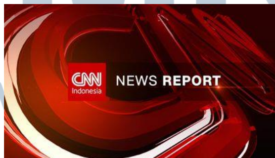
Gambar 3.7. CNN News Report