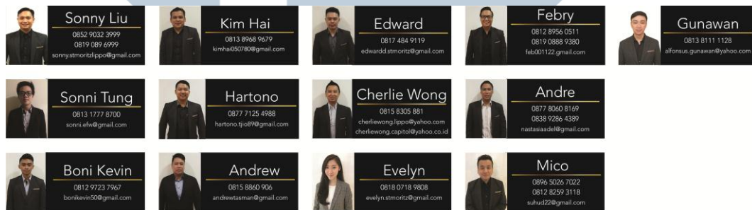
Gambar 3.3 Stiker Nama The St. Moritz

bekerja secara cepat. Setelah selesai, penulis memperlihatkan hasilnya apakah ada yang harus di revisi atau tidak, dan jika sudah approved , stiker akan diproses cetak. Ternyata penulis masih harus melakukan revisi, karena ukurannya yang diubah dan tidak rapi, dan diperlihatkan kepada pembimbing lapangan. Penulis melakukan revisi untuk memperbaiki ukuran file yang awalnya 7 x 3 cm diubah menjadi 7 x 2,5 cm, dan dirapikan, setelah diperlihatkan kepada pembimbing lapangan. Penulis harus melakukan revisi kembali karena marketing manager ingin dimasukan logo The St. Moritz, setelah dimasukan ternyata hasilnya kurang bagus, maka penulis harus melakukan revisi lagi untuk menghapus logo The St. Moritz. Setelah mendapatkan persetujuan oleh pembimbing lapangan dan marketing manager , akhirnya stiker nama diproses cetak dan harus menunggu 2 hingga 3 hari untuk jadi dan sampai ke kantor penulis.