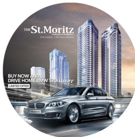
Gambar 3. 2 Stiker The St. Moritz

Setelah selesai, penulis memperlihatkan hasil kerja kepada pembimbing lapangan untuk dilihat apakah ada kesalahan atau tidak. Ternyata hasil editan yang penulis buat tidak terlalu rapi karena penulis memotong bentuk lingkaran secara manual, sehingga harus melakukan revisi untuk memotong lingkaran menggunakan elliptical marquee tools , dan diperlihatkan kepada pembimbing lapangan. Penulis harus melakukan revisi kembali karena warna background stiker harus diubah menjadi lebih terang, dan kembali diperlihatkan kepada pembimbing lapangan. Akhirnya, penulis harus melakukan revisi terakhir karena penulis tidak memasukan hal yang cukup penting pada gambar yaitu mencantumkan tulisan “ Disclaimer: Image & Rendering are Artist Impressions only. *Terms & Conditions Apply ”