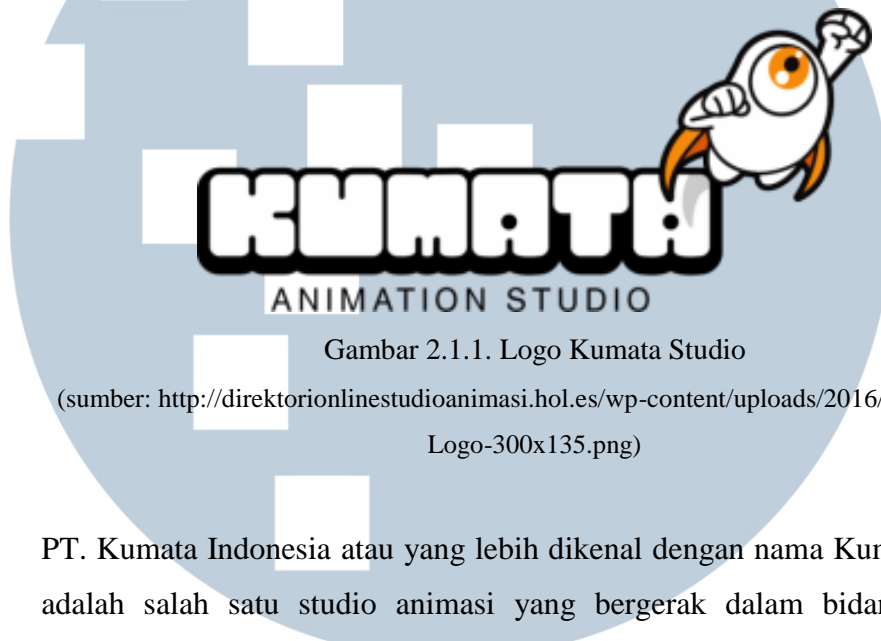
Gambar 2.1.1. Logo Kumata Studio