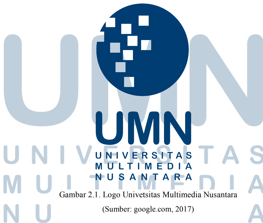
Gambar 2.1. Logo Universitas Multimedia Nusantara

Universitas Multimedia Nusantara merupakan Perguruan Tinggi Swasta yang berjalan dibawah naungan Yayasan Multimedia Nusantara yang didirikan oleh Kompas Gramedia, pada tanggal 25 November 2005, dan diumumkan secara resmi pada 20 November 2006 oleh Sekretaris Jenderal Kementerian Pendidikan Nasional. Universitas Multimedia Nusantara merupakan bertempat di Tangerang, Jl. Scientia Boulevard, Gading Serpong. Universitas Multimedia Nusantara mempunyai visi untuk menjadi Perguruan Tinggi yang unggul dibidang ICT, yang menghasilkan lulusan berwawasan internasional, dan mempunyai misi untuk turut serta mencerdaskan kehidupan bangsa dan memajukan kesejahteraan bangsa melalui upaya penyelenggaraan pendidikan tinggi dengan melaksanakan Tridarma Perguruan Tinggi, untuk meningkatkan kualitas sumber daya manusia Indonesia ( umn.ac.id , diakses 23 Agustus 2017)