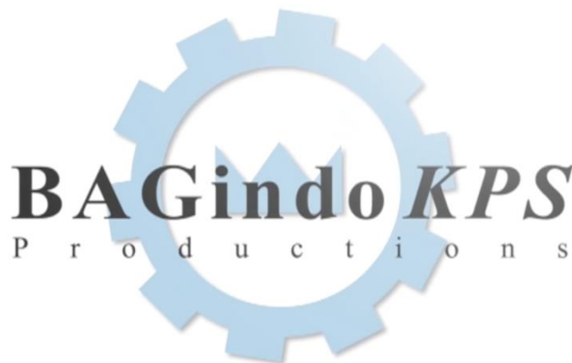
Gambar 2.1. Logo Bagindo Kayu Putih Selatan