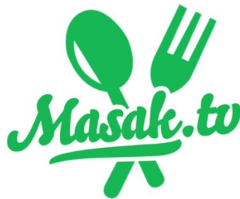
Gambar 2.2. Logo Masak.TV

Masak.TV merupakan salah satu konten podcast yang di produksi oleh PT. Bagindo Kayu Putih Selatan dalam Youtube dengan channel Masak.TV. Tidak hanya melalui Youtube, Masak.TV juga mengembangkan video mealui media sosial, seperti Facebook. Instagram, Twitter, dan juga melalui Linikini. Masak.TV dibentuk berawal dari banyaknya teman-teman dari Roby Bagindo yang menetap di luar negeri dan merindukan masakan Indonesia, dan Roby Bagindo memutuskan untuk membuat sebuah video internet yang menyajikan resep-resep Nusantara bagi masyarakat di Indonesia maupun di luar negeri.