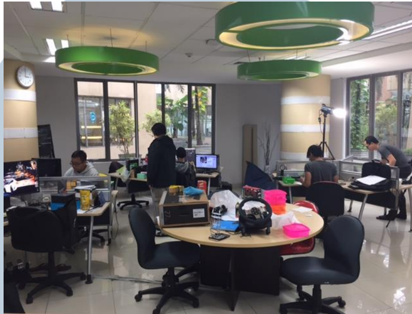
Gambar 3.1. Suasana Kantor INIGAME