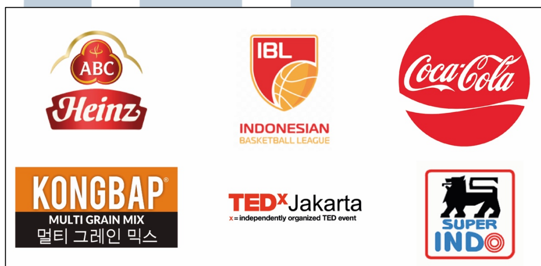
Gambar 2.2. Klien PT. Bagindo KPS

Awalnya, PT. Bagindo KPS memproduksi project televisi, company profile hingga tugas kampus dari mahasiswa berbagai kampus. Pada tahun 2008, salah satu acara mereka di televisi swasta diberhentikan dan mempengaruhi roda keuangan, mereka pun melihat peluang bisnis baru, yaitu online . Sekitar tahun 2007/2008, mereka membuat acara macindos.tv di Blip.tv dan Fiddler namun audiensnya yang tidak terlalu besar dan saham Blip.TV dibeli oleh Youtube menyebabkan platform utama pindah ke Youtube.