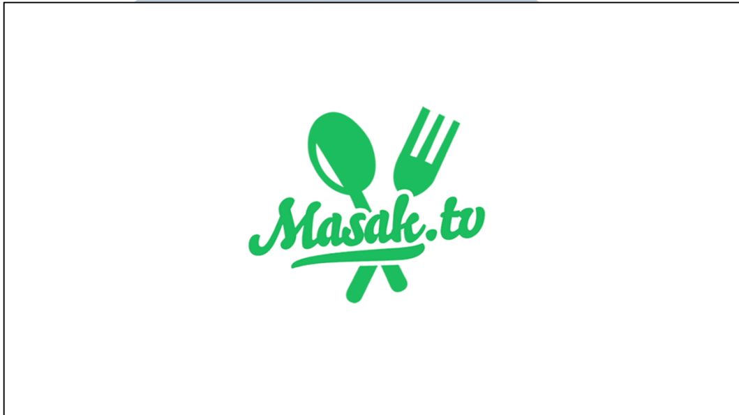
Gambar 2.3. Logo Masak.TV