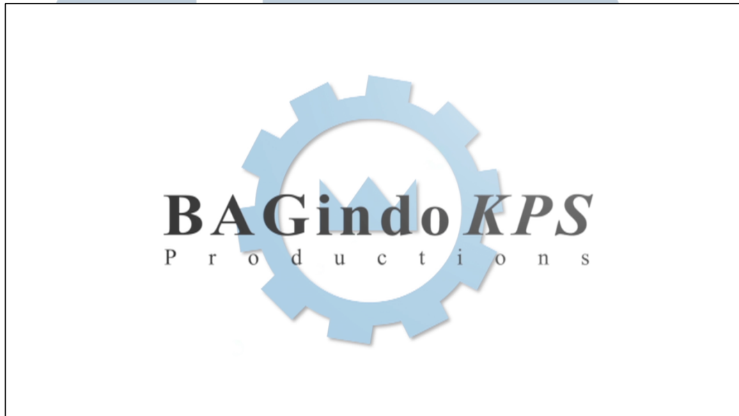
Gambar 2.1. Logo PT. Bagindo KPS