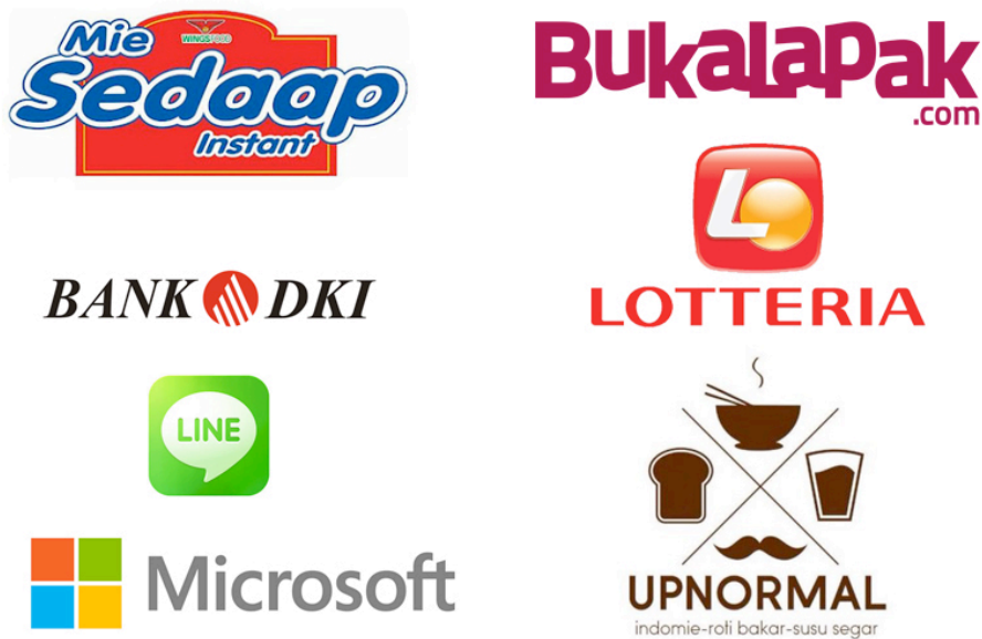
Gambar 2.2. Logo Klien

Sementara itu, klien yang ditangani sekarang, antara lain: