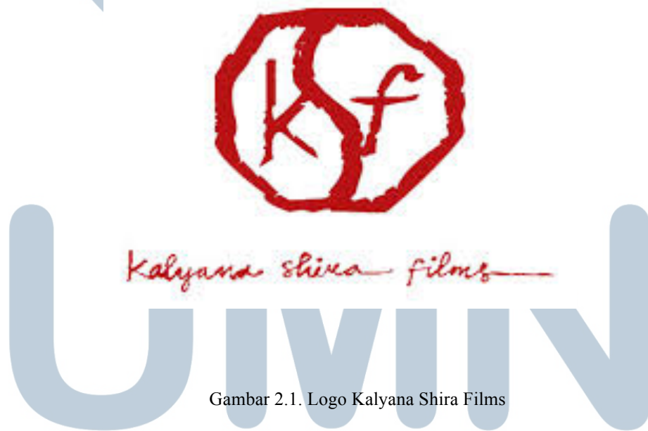
Gambar 2.1. Logo Kalyana Shira Films

Films berkontribusi dalam memberikan informasi dan menghidupkan media ekspresi bagi kaum perempuan, anak-anak dan kaum marjinal. Misi dari Kalyana Shira Films adalah untuk memberi dukungan untuk masyarakat dalam memperkuat nilai demokrasi dan kemanusiaan, juga membantu terbentuknya kesetaraan dalam kehidupan bermasyarakat di Indonesia melalui film atau medium audio visual lainnya. Selain itu Kalyana Shira Films juga mendukung perkembangan perfilman Indonesia secara aktif, dengan memberikan kesempatan kepada sumber daya manusia yang berpotensi menggunakan medium film dan audio visual lainnya untuk menyampaikan gagasannya.