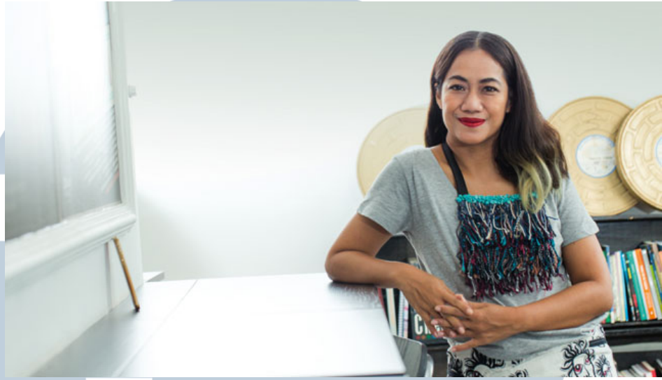
Gambar 2.2. Nia Dinata