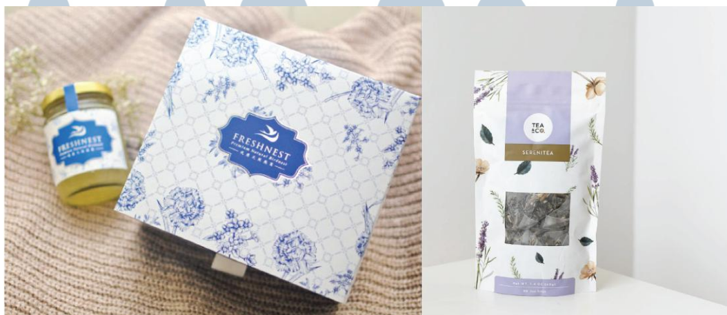
Gambar 2.3 Portfolio Crave for Art

Logo dari CFA terdiri dari logogram , logotype , dan tagline . Logogram CFA terdapat siluet tupai karena hewan tupai memiliki mata yang tajam dan hewan yang berkoloni sehingga tupai merepresentasikan para desainer grafis di CFA. Tagline pada logo mengartikan bahwa CFA dapat mewujudkan desain yang unik dengan ide yang baru kepada para klien. Penggunaan warna emas pada logo untuk menampilkan kesan elegant dan classy dengan alasan CFA memiliki target audiens yang merupakan menengah keatas (C. Safira, wawancara pribadi, 4 September 2017).