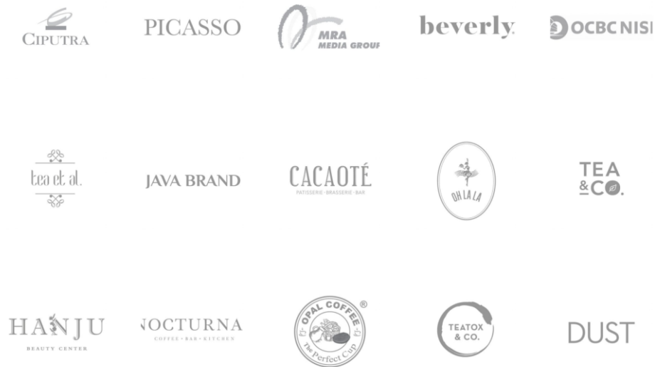
Gambar 2.4 Klien Crave for Art

Berikut adalah beberapa klien yang pernah ditangani oleh Crave for Art