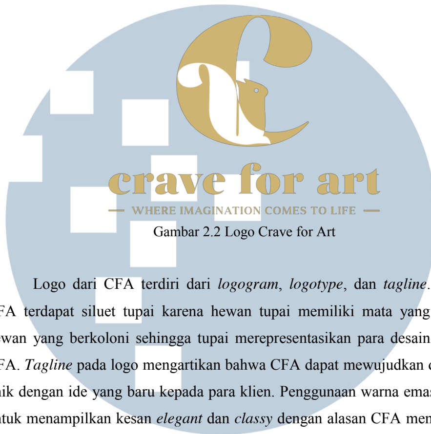
Gambar 2.2 Logo Crave for Art

Logo dari CFA terdiri dari logogram , logotype , dan tagline . Logogram CFA terdapat siluet tupai karena hewan tupai memiliki mata yang tajam dan hewan yang berkoloni sehingga tupai merepresentasikan para desainer grafis di CFA. Tagline pada logo mengartikan bahwa CFA dapat mewujudkan desain yang unik dengan ide yang baru kepada para klien. Penggunaan warna emas pada logo untuk menampilkan kesan elegant dan classy dengan alasan CFA memiliki target audiens yang merupakan menengah keatas (C. Safira, wawancara pribadi, 4 September 2017).