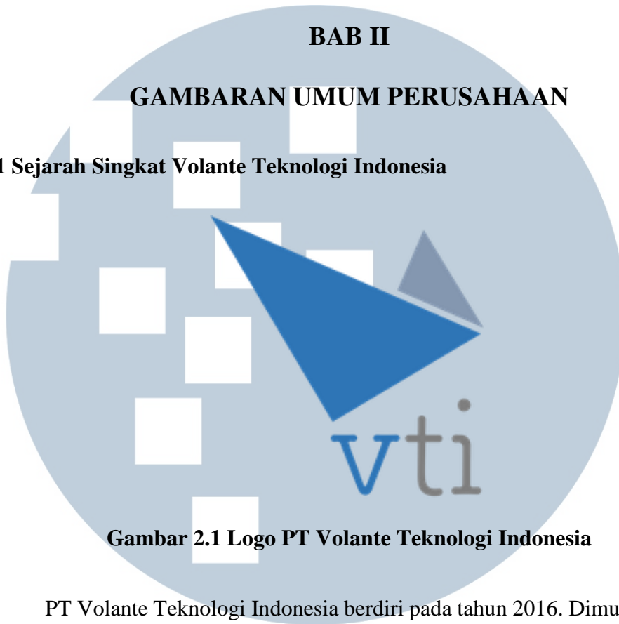
Gambar 2.1 Logo PT Volante Teknologi Indonesia