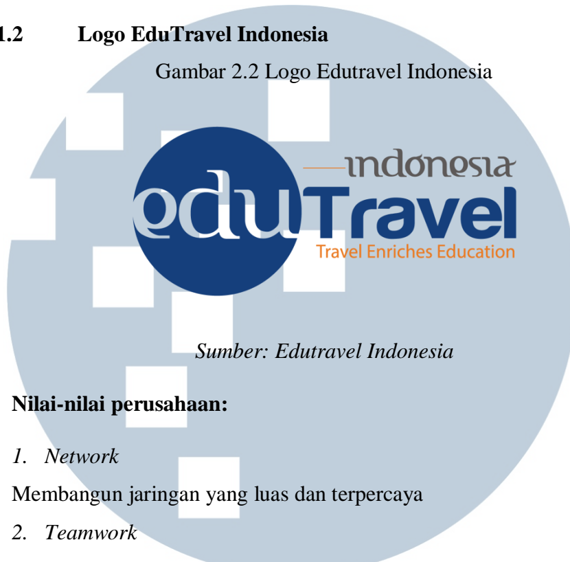
Gambar 2.2 Logo Edutrael Indonesia