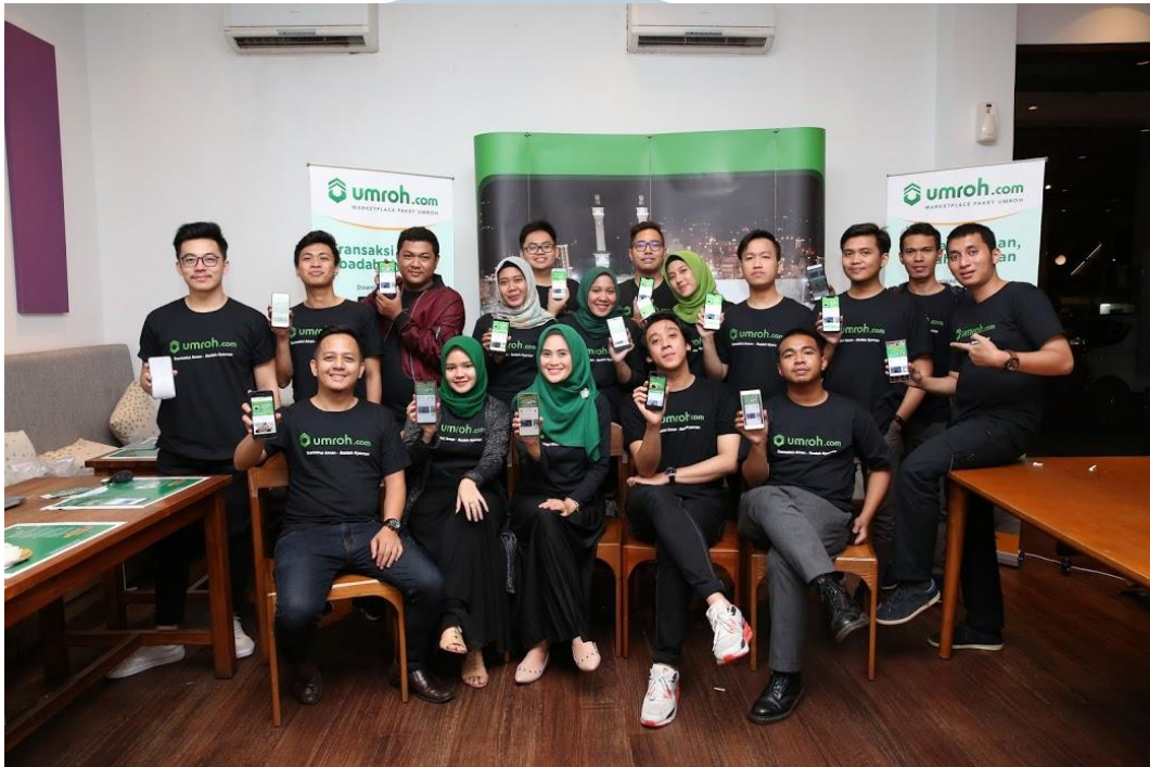
Gambar 2.2. Press Conference Launching Mobile Application Umroh.com