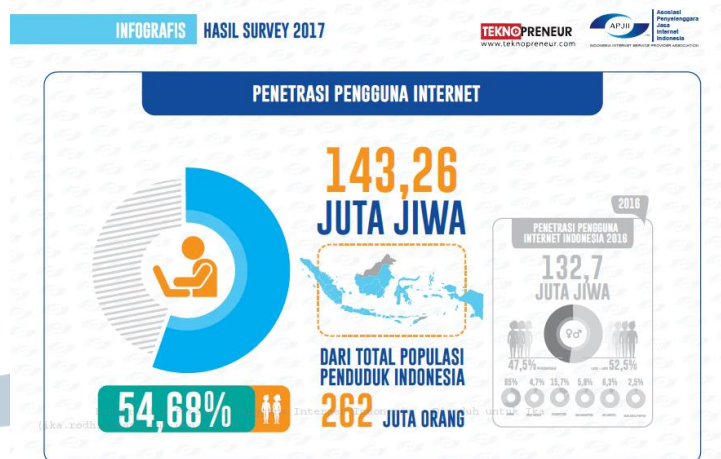
Gambar 1.1 Penetrasi Pengguna Internet