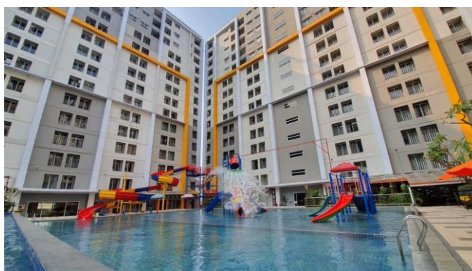
Gambar 2.4 Semi Olympic Swimming Pool