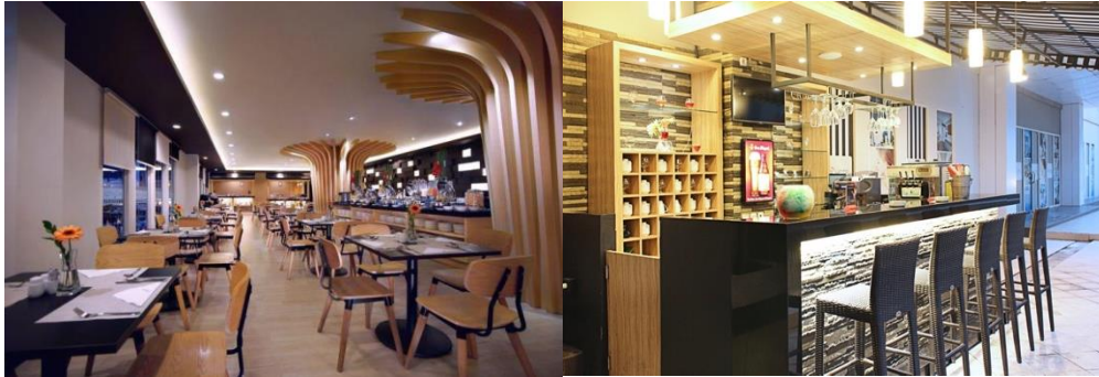
Gambar 2.5 YuGo Restaurant dan Anima Pool Side Lounge