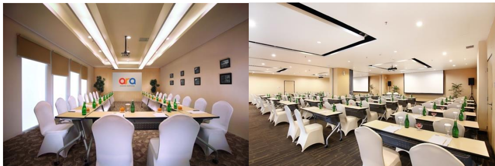
Gambar 2.3 Meeting Room