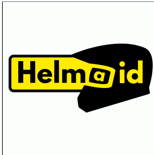
Gambar 2.1 Logo Perusahaan Helmaid Indonesia(Bryan,2019)

Helmaid Indonesia adalah sebuah perusahaan yang bergerak di bidang otomotif tepatnya perawatan dan pencucian helm. Helmaid didirikan pada tahun 2018 oleh dua orang, Bryan Liliko dan Rufin Arizonda dengan pengalaman yang mereka tekuni selama ini (Bryan, 2019).