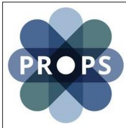
Gambar 2.1 Logo Perusahaan PT. Promedia Punggawa Satu