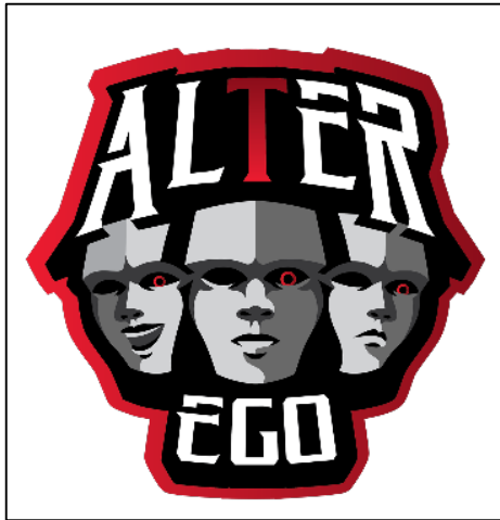
Gambar 2.1 Logo Alter Ego (Supreme League)

Supreme League mengembangkan tim esports pada tahun 2018 dengan nama Alter Ego Esport . Tim Alter Ego esports , dianggap sebagai salah satu tim esport yang tumbuh paling cepat Dalam waktu kurang dari setahun, Alter Ego dianggap sebagai salah satu dari 3 tim teratas esports Indonesia. Tim Alter Ego Esports terus bersaing di turnamen terbesar di dunia. Alter Ego esports memberi banyak prestasi diberbagai permainan. Alter Ego Esports juga merupakan bagian dari liga Mobile Legends MPL . Liga Mobile Legends MPL adalah salah satu turnamen permainan Mobile Legends terbesar. Turnamen ini selalu berlangsung dengan antusiasme tinggi dari masyarakat. Hal ini terlihat dari jumlah penonton online yaitu 298.000 orang dan jumlah penonton offline sebanyak 10.000 orang.