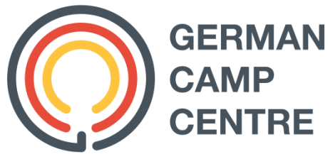
Gambar 2.1. Logo German Camp Centre