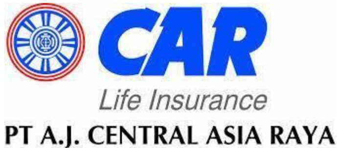
Gambar 2. 1 Logo Perusahaan

PT A.J. Central Asia Raya (CAR Life Insurance) didirikan pada tanggal 30 April 1975 berdasarkan Akta Notaris Ridwan Suselo no. 357 dan disahkan dengan Surat Keputusan Menteri Kehakiman Republik Indonesia No. Y.A. 5/450/6 tanggal 9 Desember 1975. CAR pertama kali mendapat izin usaha berdasarkan Surat Keputusan Menteri Keuangan Republik Indonesia No.KEP.492/DJM/III-5/11/1975 Tanggal 15 November 1975. Setelah beberapa kali perpanjangan perijinan usaha, secara tetap dan tanpa batas Perusahaan mendapat izin usaha perasuransian dari Kementerian Keuangan R.I. Nomor: KEP-013/KM.13/1987, tanggal 18 Desember 1987. (CAR, 2019)