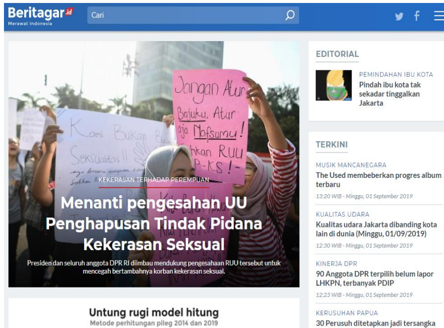
Gambar 2.3 Halaman Utama Beritagar.id