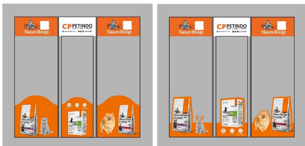
Gambar 3.15 Mockup Revisi Kedua Untuk Stiker kaca Laras Graha

Penulis kembali mendapatkan revisi kedua setelah penulis mengirimkan hasil revisi pertama kepada klien. Untuk revisi kedua, klien meminta mengganti model stiker menjadi cutting atau stiker dibentuk mengikuti gambar produk/anjing dan kucing agar tidak terlalu kaku. Penulis juga diminta membuat dua alternatif untuk cutting stiker ini.