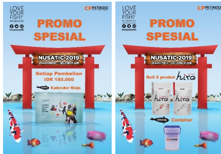
Gambar 3.9 Desain Poster Promo NUSATIC 2019

Dalam mengerjakan proyek ini, penulis mengalami beberapa kendala. Terjadinya miscommunication antar tim marketing dalam proses revisi sehingga penulis kesulitan untuk melakukan revisi yang benar. Selain itu, saat mengerjakan proyek poster NUSATIC ini, penulis juga melakukan tugas lain seperti branding stiker dan banner untuk pet shop sehingga penulis cukup kesulitan untuk menyelesaikan seluruh tugas yang diberikan dengan tepat waktu. Solusi dari kendala-kendala yang ada adalah, penulis lebih aktif bertanya kepada pembimbing lapangan mengenai revisi desain hingga penulis dapat membuat desain yang sesuai dengan brief yang sebelumnya sudah didiskusikan dan untuk solusi kedua, penulis membuat time table untuk masing-masing tugas sehingga penulis lebih mudah menyelesaikan pekerjaan dengan baik dan tepat waktu.