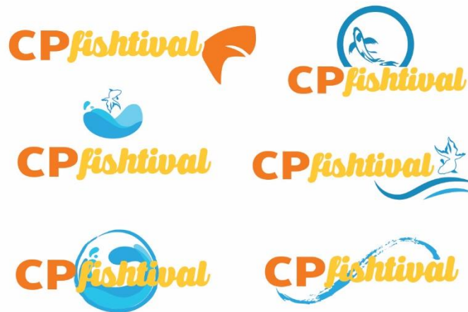
Gambar 3.17 Desain Alternatif Logo CP FISHTIVAL

Penulis menunjukkan sketsa alternatif logo CP FISHTIVAL kepada tim marketing dan tim marketing meminta penulis untuk lebih melakukan eksplorasi pada logo CP FISHTIVAL yang terakhir dan memintanya dalam bentuk digital. Penulis kembali membuat beberapa alternatif logo CP FISHTIVAL dalam bentuk digital.