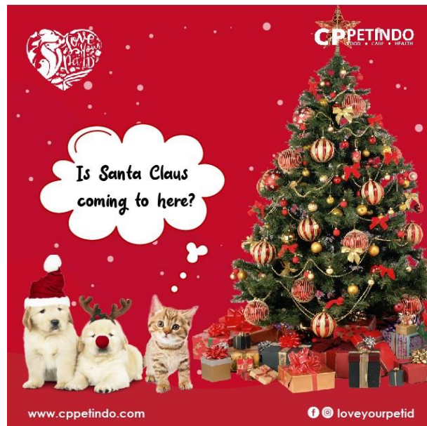
Gambar 3.10 Desain Feed 1 Untuk Natal Bersama CP PETINDO

Proses untuk menjalankan event ini adalah, penulis dipercaya untuk mendesain feed yang berupa pemberitahuan tentang diadakannya event ini. Sebelum membuat desain, penulis menerima brief dari tim marketing untuk menjelaskan konsep yang akan digunakan. Setelah melakukan brief , tim marketing dan penulis setuju untuk menggunakan warna merah sebagai background untuk lebih menunjukkan kesan Natal. Penulis juga diminta untuk memasukkan foto anjing dan kucing sebagai penanda bahwa event ini untuk shelter yang menampung anjing dan kucing.