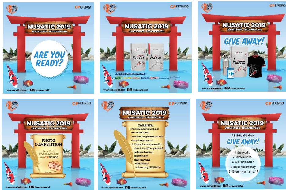
Gambar 3.8 Desain Feed Instagram Untuk NUSATIC 2019

Penulis kembali melanjutkan desain untuk feed Instagram yang akan lebih menjelaskan promo-promo yang ditawarkan oleh CP PETINDO di NUSATIC 2019, seperti pengumuman tentang hadirnya CP PETINDO di NUSATIC 2019, acara Give Away , Photo Competition dan pengumuman pemenang dari Give Away .