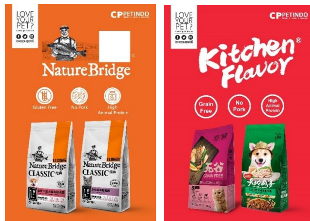
Gambar 3.12 Desain Shop Sign Untuk Laras Graha Satwa

Salah satu branding pet shop yang penulis kerjakan adalah untuk Laras Graha Satwa. Penulis diminta mendesain untuk shop sign dan juga stiker kaca. Untuk banner , penulis diarahkan untuk membuat dua shop sign menggunakan produk Kitchen Flavor dan Nature Bridge dengan ukuran 90 cm x 130 cm dengan menggunakan GSM dari perusahaan yang sudah ditentukan seperti memasukkan slogan perusahaan yaitu “ Love Your Pet? ” dengan posisi di sisi kiri atas dan logo perusahaan CPPETINDO di sisi kanan atas dengan warna yang disesuaikan dengan warna background .