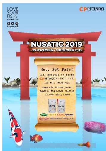
Gambar 3.6 Desain Akhir Poster NUSATIC 2019

Penulis membuat 2 alternatif desain kemudian mengirimkan hasil desain ke tim marketing melalui pembimbing lapangan. Setelahnya, tim marketing memilih alternatif desain kedua, penulis juga mendapatkan feedback untuk merevisi desain dengan menambahkan produk-produk makanan ikan yang akan dijual di NUSATIC 2019 dengan menonjolkan produk HIRO sebagai produk utama yang dijual oleh CP PETINDO.