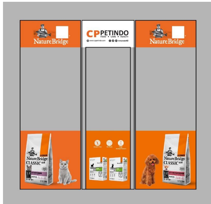
Gambar 3.14 Mockup Revisi Untuk Stiker Kaca Laras Graha

Penulis kembali mendapatkan revisi kedua setelah penulis mengirimkan hasil revisi pertama kepada klien. Untuk revisi kedua, klien meminta mengganti model stiker menjadi cutting atau stiker dibentuk mengikuti gambar produk/anjing dan kucing agar tidak terlalu kaku. Penulis juga diminta membuat dua alternatif untuk cutting stiker ini.