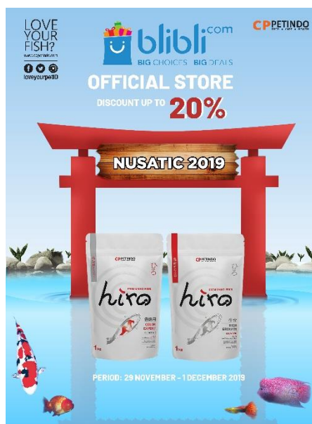
Gambar 3.7 Desain Awal Poster NUSATIC 2019 Untuk BliBli.com (Sumber: Data Internal Perusahaan, 2019)

Setelah membuat desain untuk perusahaan, penulis juga diminta untuk mendesain poster dengan konsep yang sama namun untuk salah satu e-commerce yang bekerja sama dengan CP PETINDO di NUSATIC 2019, yaitu Blibli.com. Pihak Blibli.com meminta poster berukuran 80cm x 60cm dengan posisi vertikal dengan ketentuan menginformasikan masyarakat bahwa dari pihak Blibli.com akan memberikan potongan diskon 20% jika membeli produk makanan ikan CP PETINDO melalui aplikasi Blibli.com.