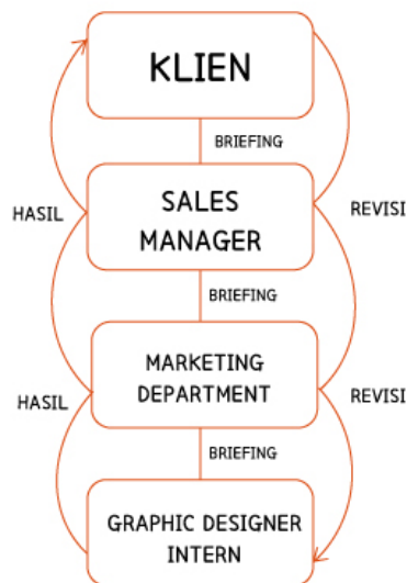
Gambar 3.1. Struktur Koordinasi di PT Central Proteina Prima

Apabila saat mengerjakan kerjaan dan mendapatkan sebuah kritik dan saran yang diberikan oleh pihak marketing ataupun Sales Manager , penulis akan melakukan revisi tentang apa yang disarankan. Berikut adalah alur kerja koordinasi di PT Central Proteina Prima, Tbk: