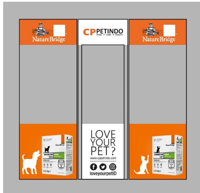
Gambar 3.13 Mockup Desain Awal Untuk Stiker Kaca Laras Graha

ukuran 103 cm x 46 cm. Produk CP PETINDO yang digunakan untuk stiker kaca ini adalah produk Nature Bridge Vet cat and dog .