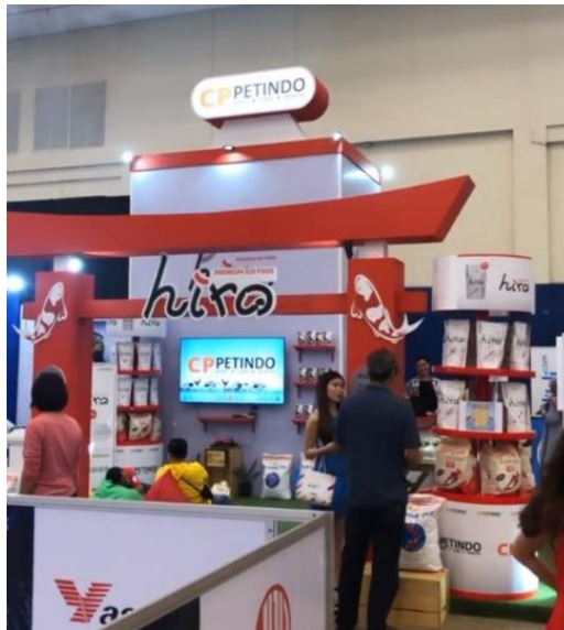
Gambar 3.2 Booth CP PETINDO di NUSATIC 2019

Pembuatan desain diawali dengan melakukan briefing dengan tim marketing untuk menentukan konsep yang sesuai dengan booth CP PETINDO. Dalam hal ini, penulis menyarankan untuk memasukkan gambar gapura merah yang sama dengan seperti gapura yang berada di booth CP PETINDO di NUSATIC 2019.