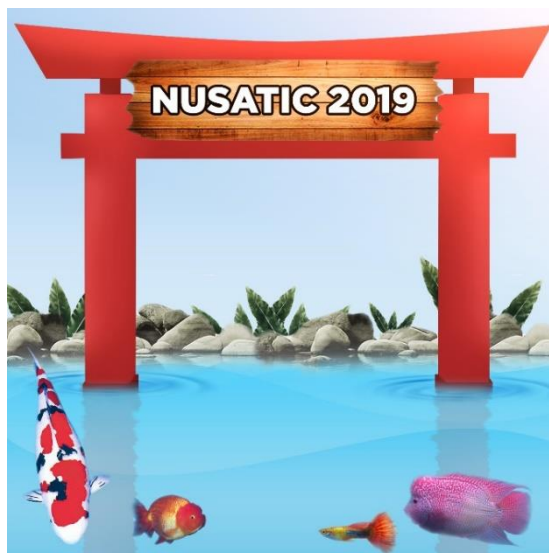
Gambar 3.3 Konsep Desain Poster NUSATIC 2019

Pembuatan desain diawali dengan melakukan briefing dengan tim marketing untuk menentukan konsep yang sesuai dengan booth CP PETINDO. Dalam hal ini, penulis menyarankan untuk memasukkan gambar gapura merah yang sama dengan seperti gapura yang berada di booth CP PETINDO di NUSATIC 2019.