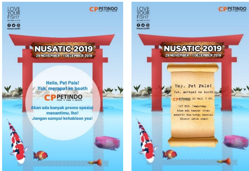
Gambar 3.5 Alternatif Desain Awal Poster NUSATIC 2019

Penulis membuat 2 alternatif desain kemudian mengirimkan hasil desain ke tim marketing melalui pembimbing lapangan. Setelahnya, tim marketing memilih alternatif desain kedua, penulis juga mendapatkan feedback untuk merevisi desain dengan menambahkan produk-produk makanan ikan yang akan dijual di NUSATIC 2019 dengan menonjolkan produk HIRO sebagai produk utama yang dijual oleh CP PETINDO.