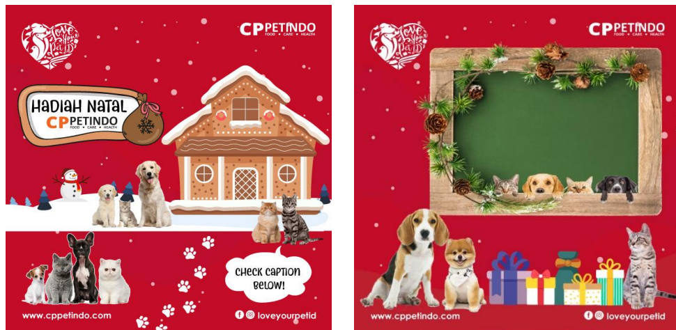
Gambar 3.11 Desain Feed 2 & 3 Untuk Natal Bersama CP PETINDO

Desain untuk feed 2 , penulis diminta untuk menunjukkan suasana shelter dengan memasukkan banyak foto anjing dan kucing dan sebuah rumah yang menunjukkan bahwa itu adalah tempat shelter . Setelah feed 2 ini dipost, pengikut dari loveyourpetid dapat menceritakan tentang hewan kesayangan mereka juga menyebutkan shelter yang mereka sarankan. Pihak CP PETINDO memberikan waktu seminggu, dimulai dari tanggal 12 Desember 2019 hingga 19 Desember 2019 untuk para followers Instagram CP PETINDO yang mengikuti event ini.