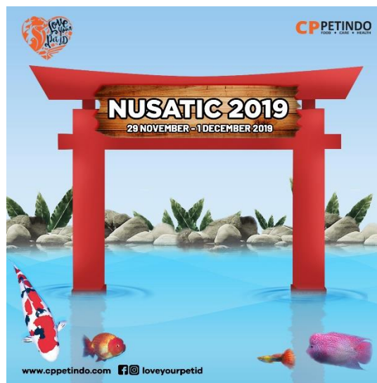
Gambar 3.4 Hasil Revisi Konsep Poster NUSATIC 2019

Setelah penulis mendesain konsep poster NUSATIC 2019, penulis mengirimkan hasilnya ke tim marketing melalui WhatsApp dan penulis mendapatkan revisi-revisi di beberapa bagian. Tim marketing meminta penulis untuk membenarkan komposisi ikan dan juga gapura agar saat ditampilkan di Instagram Feed ataupun poster terlihat lebih baik, selain itu penulis diminta untuk menambahkan logo perusahaan di sisi kanan atas, logo slogan perusahaan “ Love Your Pet ID ” di sisi kiri atas, dan official sosial media dari CP PETINDO di sisi kiri bawah.