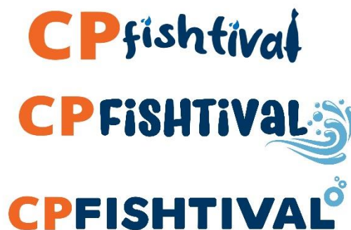
Gambar 3.18 Desain Alternatif Logo CP FISHTIVAL

Penulis kembali mendapatkan revisi untuk mengubah warna tulisan sesuai dengan tema yang diberikan atau yang berhubungan dengan ikan atau air. Penulis juga diminta untuk kembali memberikan 3 alternatif desain dalam bentuk digital. Setelah diberikan feedback , penulis segera melakukan revisi.