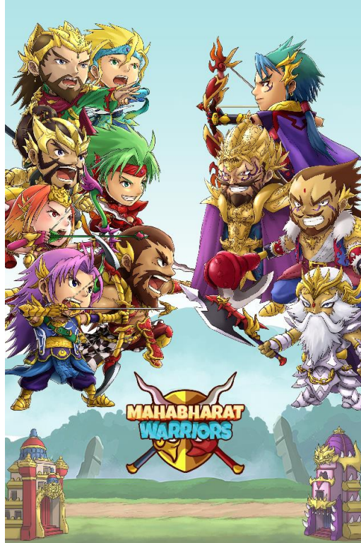
Gambar 2.4. Game berjudul Mahabarat Warriors

Mahabharat Warriors adalah permainan tower defense yang berlatar belakang pertarungan Mahabharata di mana pemain memerankan tokoh-tokoh dari sudut Pandawa melawan pasukan Kurawa. Masing-masing karakter memiliki kemampuan spesialnya. Permainan ini dapat diakses melalui Google Play Store .