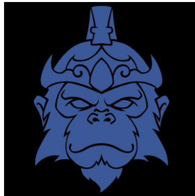
Gambar 2.1. Logo Perusahaan ( https://www.facebook.com/747489652012215/photos/1695942130500291/ )