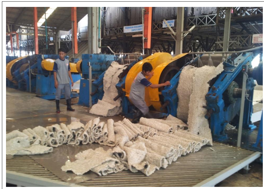
Gambar 2.2 Produksi Karet pada Pabrik

Kirana Megatara Group merupakan perusahaan produsen karet remah yang memproduksi produk SIR 10, SIR 20 dan SIR 20 VK. Tonggak sejarah Kirana Megatara Group dimulai pada tanggal 27 Oktober 1964, saat didirikannya PT Waras, yang kemudian berganti nama menjadi PT Djambi Waras. Pada tahun 1991 didirikan PT Kirana Megatara Tbk yang kini menjadi induk perusahaan bagi 14 pabrik pengolahan karet remah dan satu subholding di bidang perkebunan, yang tersebar di Sumatera dan Kalimantan, dengan kapasitas produksi 720.000 ton karet remah per tahun. Produk tersebut diekspor ke pabrik-pabrik ban terkemuka dunia seperti Apollo, Bridgestone, Continental, Cooper Tires, Fate, Good Year, Gajah Tunggal, Hankook, Kumho Tyres, Michelin, Nexen, Pirelli, Sumitomo, Toyo Tires, Yokohama Rubber dan memenuhi kebutuhan pasar dalam negeri. Sebagai puncaknya di tahun 2017, PT. Kirana Megatara Tbk melebarkan sayapnya menjadi perusahaan terbuka dan melantai di Bursa Efek pada 19 Juni 2017.