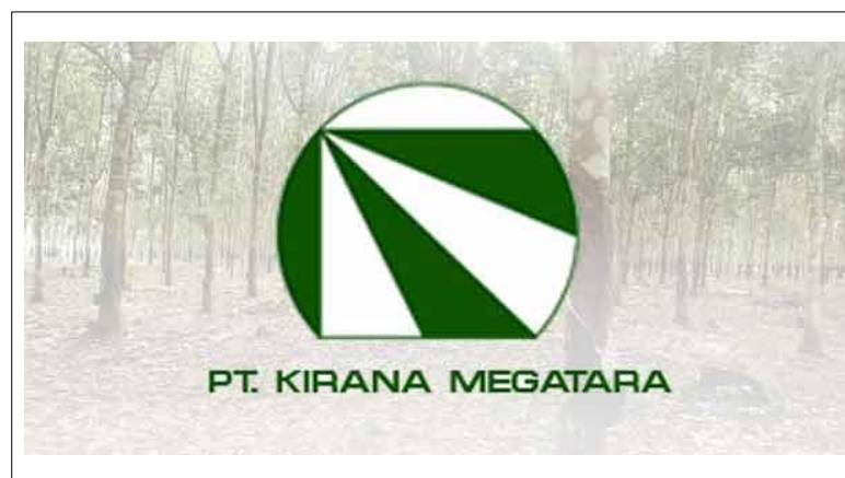
Gambar 2.1 Logo Perusahaan