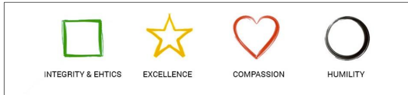
Gambar 2.4 Nilai Perusahaan

Sebagai perusahaan yang bergerak di bidang pengolahan karet PT Kirana Megatara memiliki beberapa nilai yang ditanamkan kepada seluruh karyawan yang bekerja di perusahaan. Adapun nilai – nilai tersebut dapat dilihat pada Gambar 2.4.