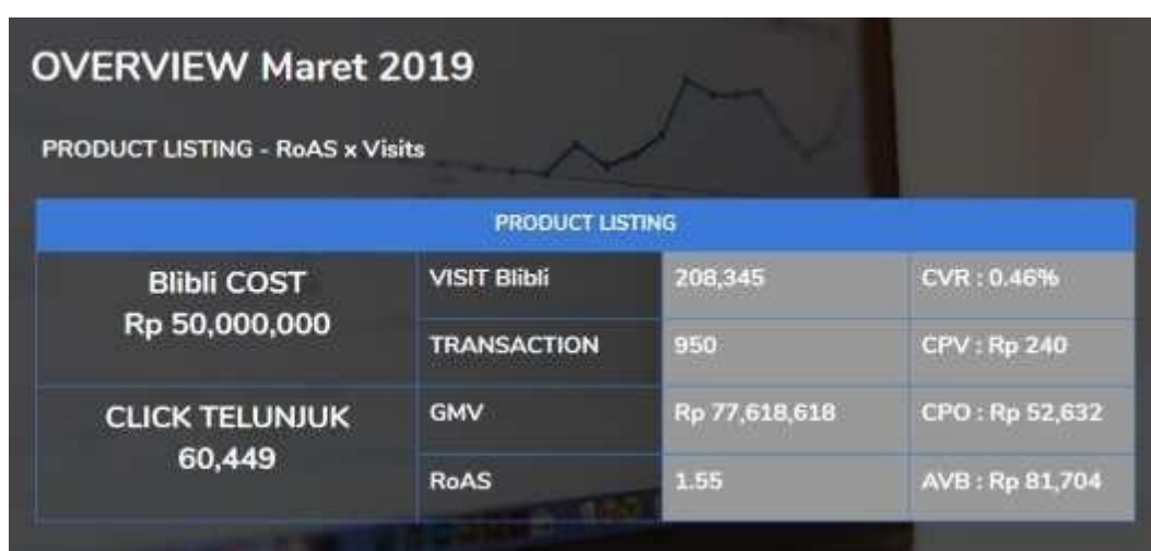
Gambar 3.3 Overview Monthly Report Blibli

Berikut adalah gambar overview monthly report Blibli pada website Telunjuk: